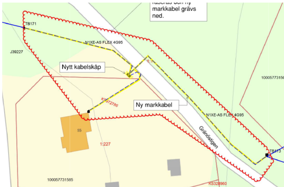
Bild 3 visar var ny markkabel grävs ner och var det nya kabelskåpet sätts.

Som särskilda skäl för strandskyddsdispensen anför sökande att området behöver tas i anspråk för att tillgodose ett angeläget allmänt intresse som inte kan ske utanför området (7 kap. 18 c § femte stycket miljöbalken).