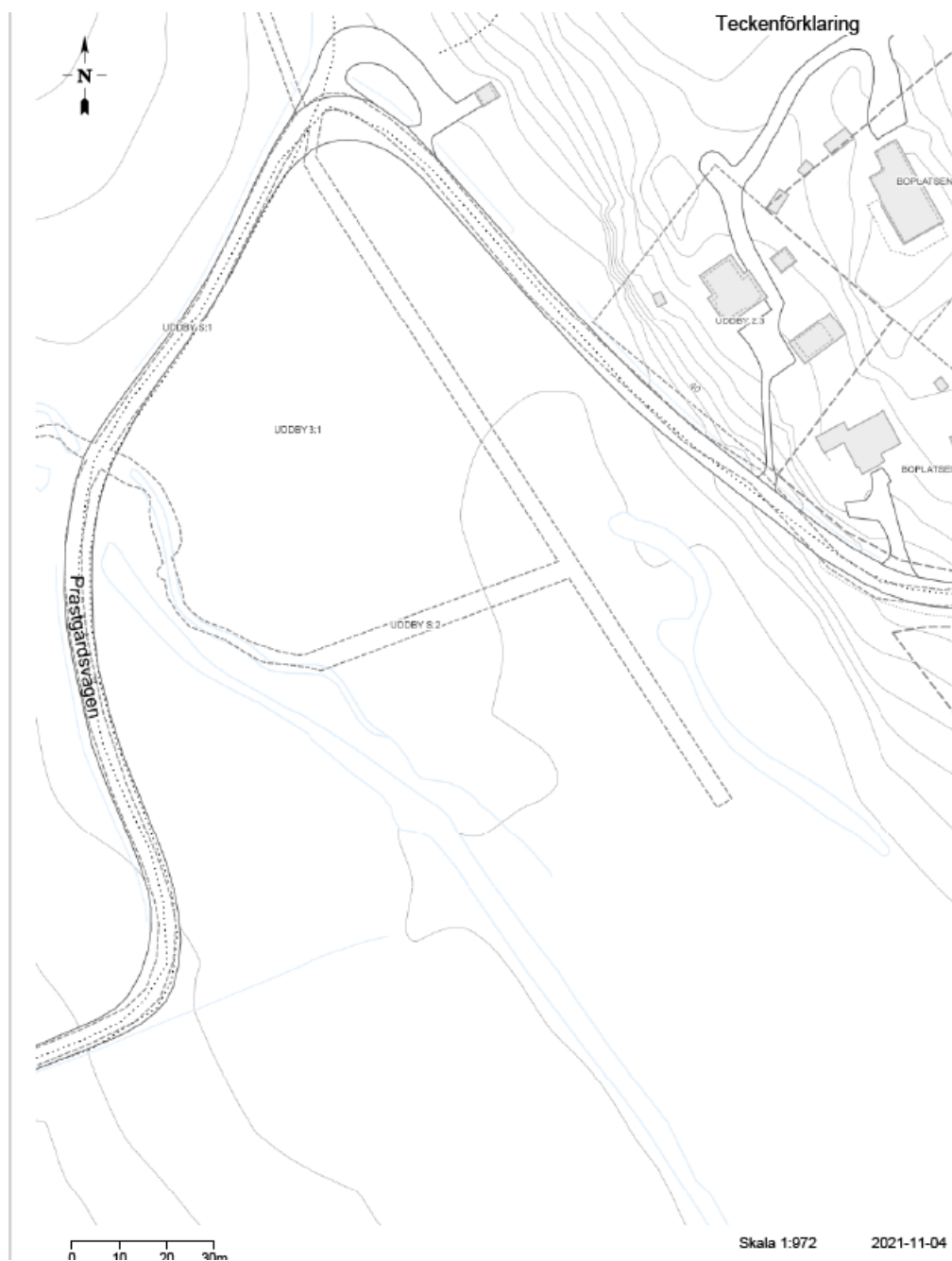
Figur 3 situationsplan

Personal som tillhör kommunstyrelseförvaltningens verksamhet naturvård inom park- och naturenheten har Alby gårds personal- och maskinbyggnad som arbetscentral. Verksamheten underhåller Alby naturreservat vars syfte är att bevara djur- och växtliv samt bevara och utveckla natur- och