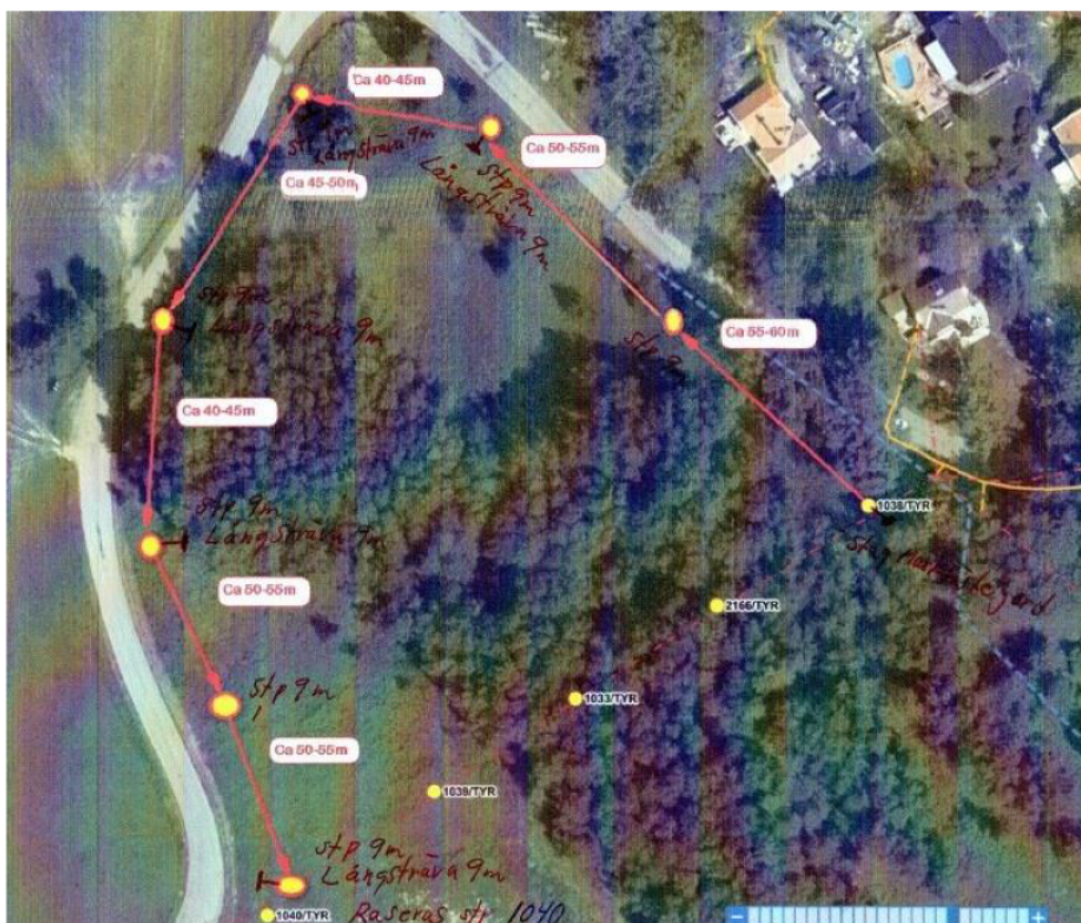
Figur 2 föreslagen stolplinje