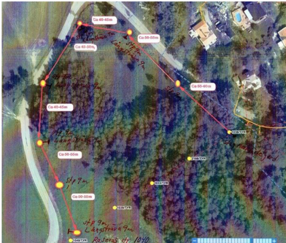
Figur 2 föreslagen stolplinje