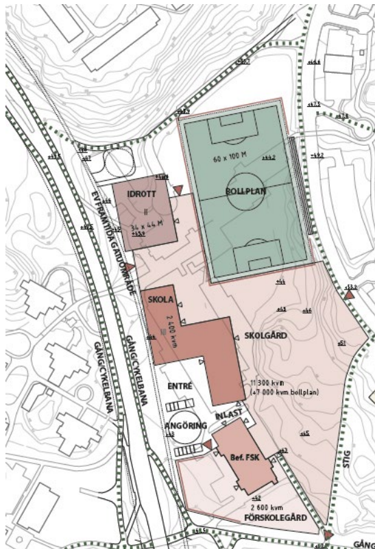
Figur 1 - Tidig skiss med förslag till 11-spelsplan

Det första förslaget var att lägga 11-spelsplanen enligt skiss nedan. Detta har visat sig inte gå då idrottshallen inte kan placeras i föreslaget läge på grund av en fjärrvärmeledning. Fjärrvärmeledningen är en huvudledning mellan Bollmora till Jordbro. Kommunens bedömning är att en flytt av fjärrvärmeledning kommer bli för kostsam samt inte kunna ske inom den tidplan som finns för Njukärrens skola.