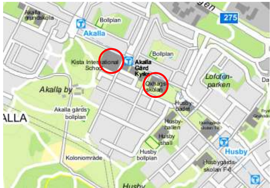
Figur 1 Skolor i Akalla