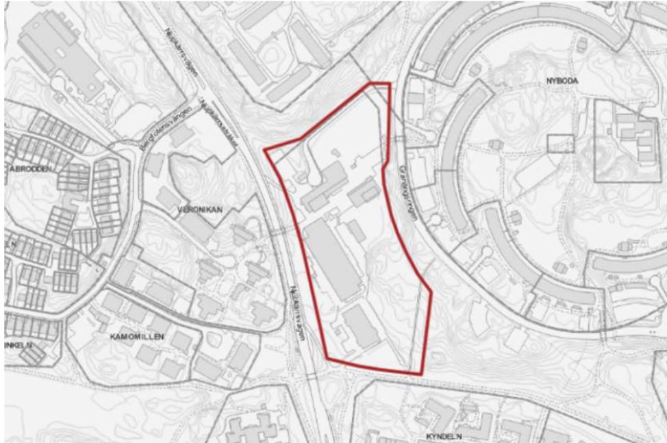
Figur 1. Karta med planområdet markerat i rött.