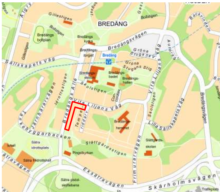
Karta visande projektområdet.

Bredäng byggdes ut på 1960-talet. Det finns nästan 5000 bostäder i Bredäng. Åttio procent av dem är hyresrätter och en fjärdedel av dem tillhör allmännyttan. Cirka tolv procent av bostäderna är bostadsrätter. Cirka sju procent är småhus. Fyrtio procent av bostäderna är treor. Det är brist på stora lägenheter, som fyror och större.