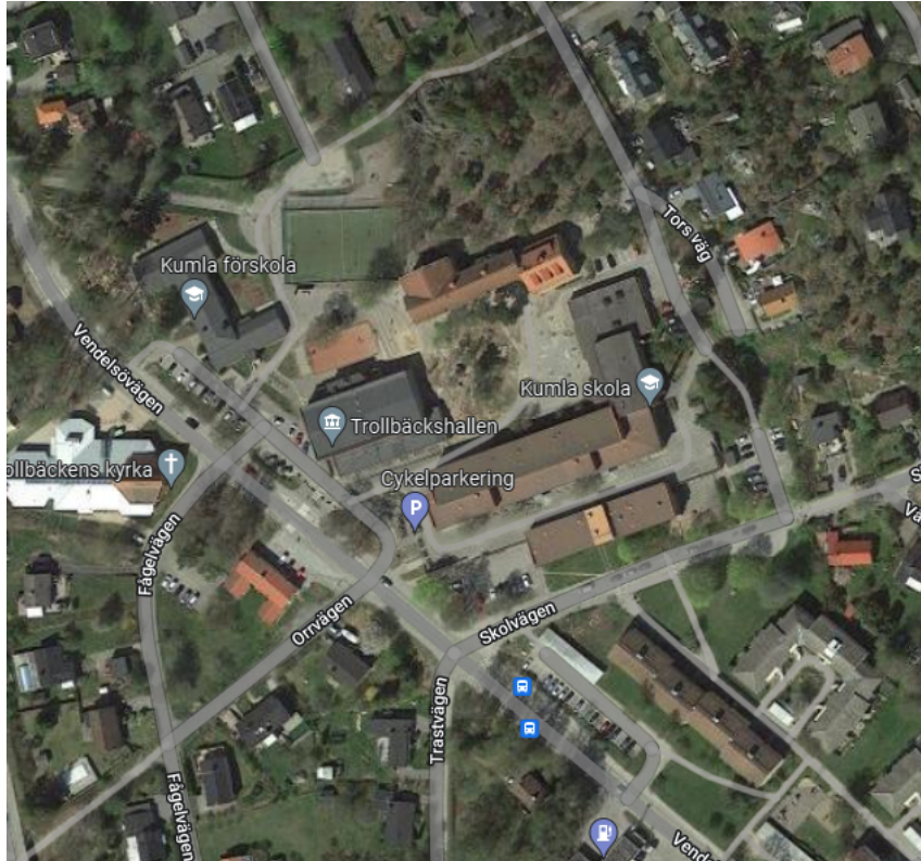
Figur 1 Kumla skola och med omgivning

I Kumla skola kommer renovering pågå de närmaste tre åren. Tidplanen är tight, och under arbetet kommer ungefär halva skolan evakueras till Fornuddens gamla skola.