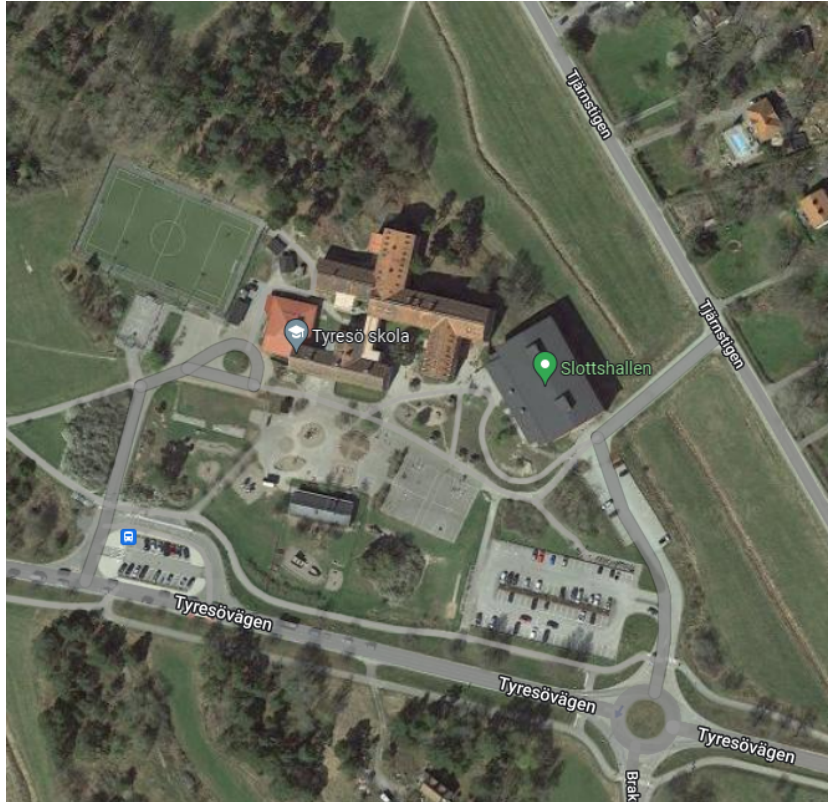
Figur 4 Tyresö skola med omgivning

Tyresö skola har en relativt stor skolgård och dessutom gränsar den till samma stora grönyta som Strandskolan, i ytans andra ände.