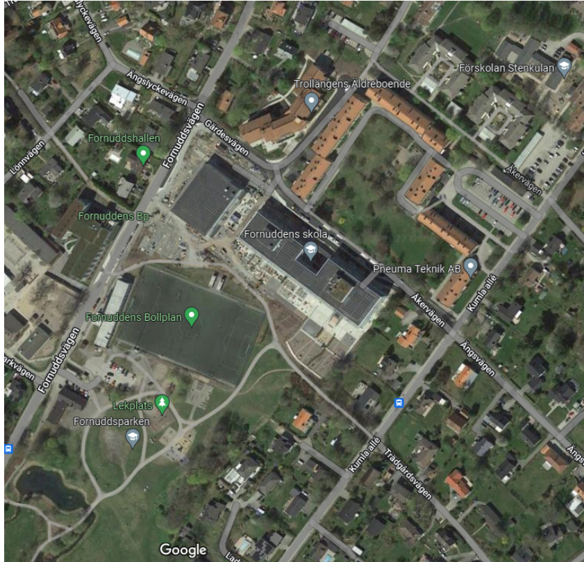
Figur 2 Fornuddens skola med omgivning

Fornuddens nya skola invigdes 2021. Skolans organisation går från den tidigare F-6 till komplett F-9 inom de närmaste åren och blir då fullbelagd.