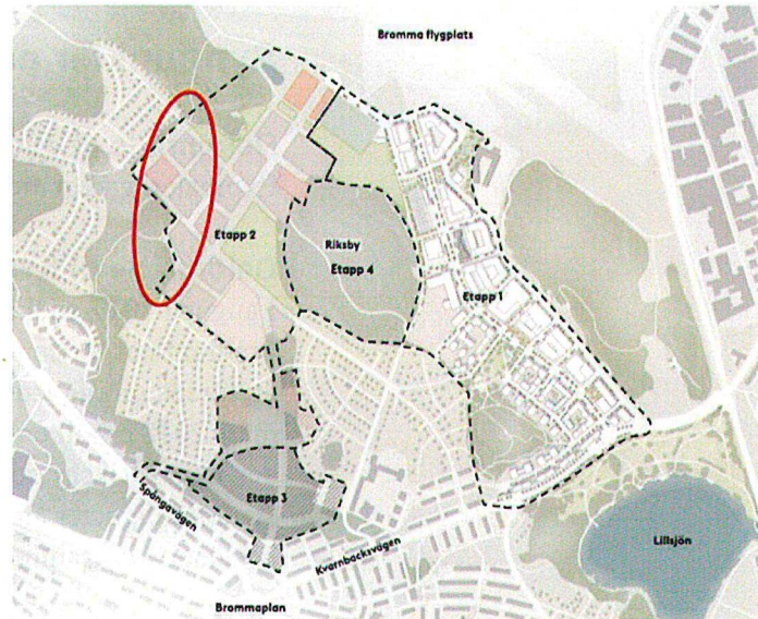
Figur 2. Markeringen avser den del av etapp 2 som berör och angränsar till riksintresse för De Geermorän.

Med anledning av riksintresset har exploateringskontoret tagit fram ett geotekniskt utlåtande av en kvartärgeolog på Sweco avseende exploateringsens eventuella påverkan på De Geer-moränerna. Utlåtandet som helhet bifogas exploateringskontorets remissvar.