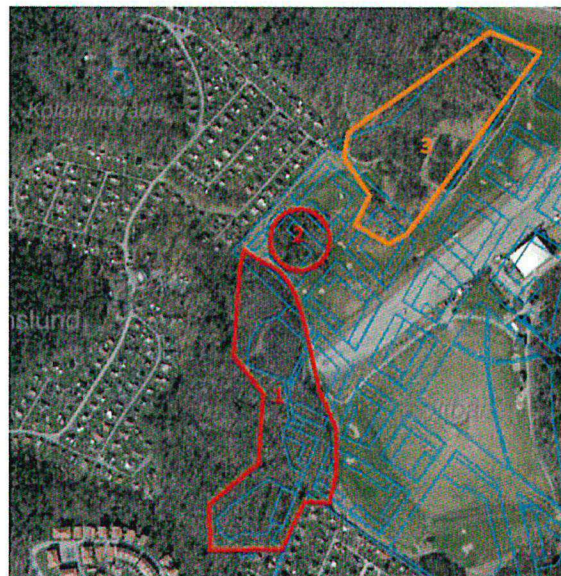
Figur 3. Flygfoto med kvartersstruktur samt de tre områdena markerade.

I utlåtandet har tre områden undersökts, dessa illustreras på karta Figur 3.