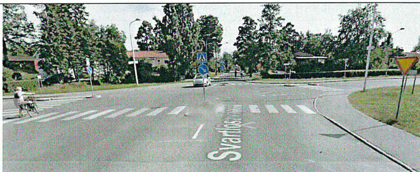
Figur 1. Svartlösavägen söderut