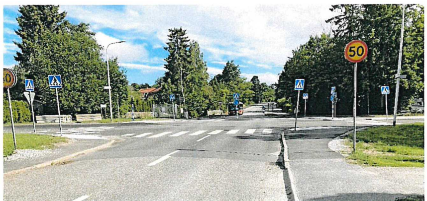
Figur 6. Svartlösavägen norrut