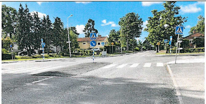
Figur 5. Svartlösavägen söderut. Utspetsad mittrefug hör till Ellevios arbete som startat efter projektets avslut.