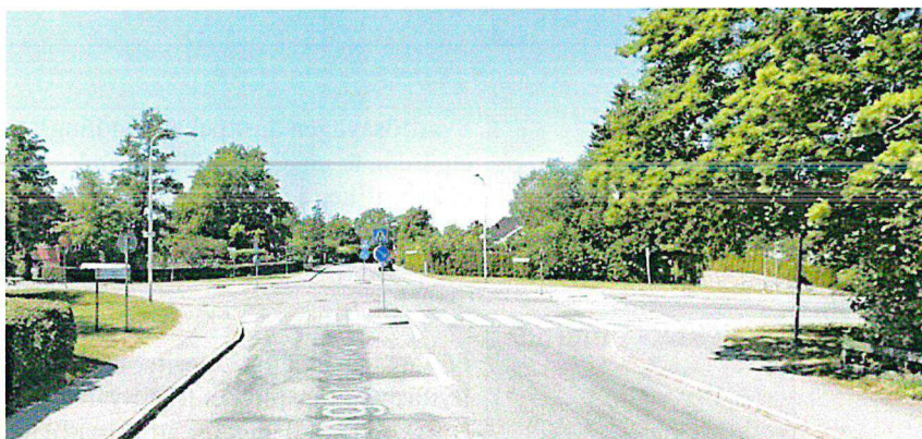
Figur 3. Långbrodalsvägen västerut