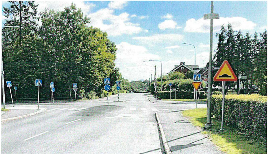
Figur 8. Långbrodalsvägen österut. Utspetsad mittrefug hör till Ellevios arbete som startade efter projektets avslut.