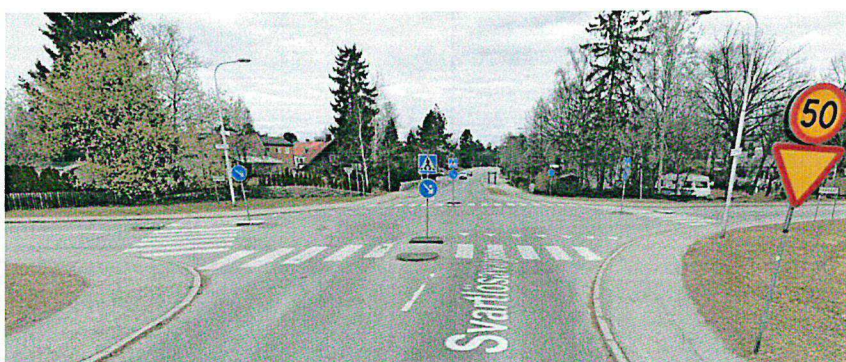
Figur 2. Svartlösavägen norrut