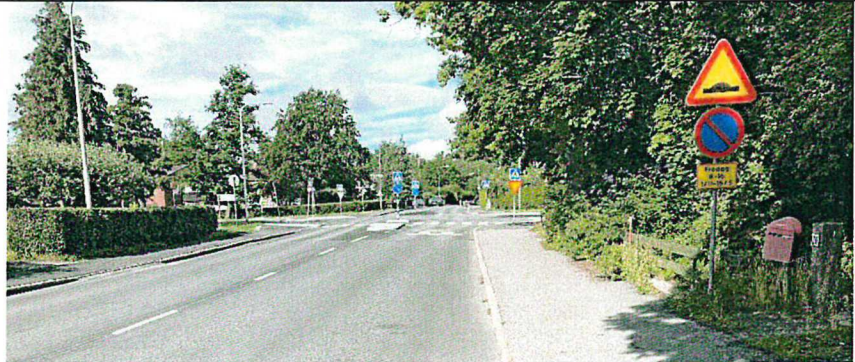
Figur 7. Långbrodalsvägen västerut