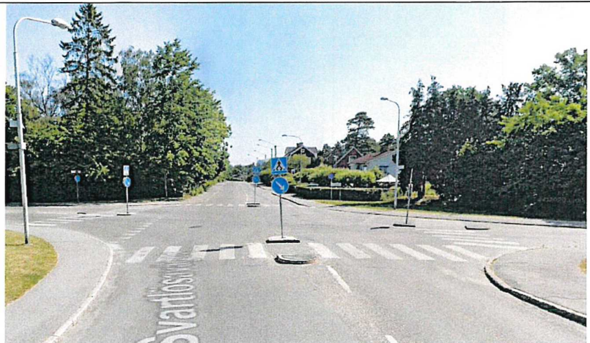
Figur 4. Långbrodalsvägen österut