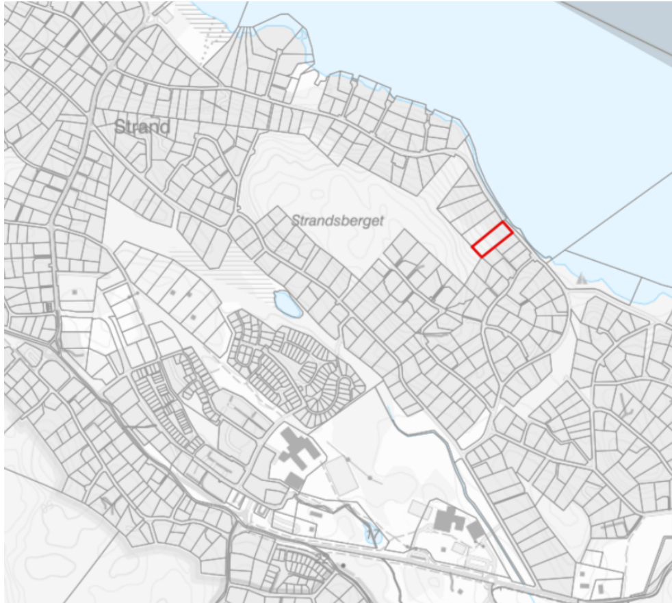
Figur 1. Karta där strand 1:318 är markerad.