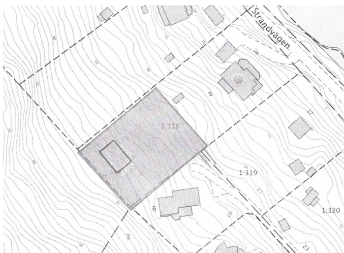
Figur 3. Skiss från den sökande med placering av byggnad.

Ägaren till fastigheten Strand 1:318 på Strandvägen 39 i kommundelen Strand inkom till kommunen i december 2020 med en förfrågan att ändra detaljplanen för att möjliggöra en styckning av fastigheten och uppföra ett enbostadshus i souterräng (se figur 3). Komplettering begärdes av den sökande där det framgick hur angöring var tänkt att anordnas samt hur bebyggelsen skulle placeras inom den tänkta fastigheten. I kompletteringen framgick det att den befintliga skaftvägen inom fastigheten Komministern 6, söder om Strand 1:318 föreslås förlängas för att möjliggöra angöring till den tänkta fastigheten.