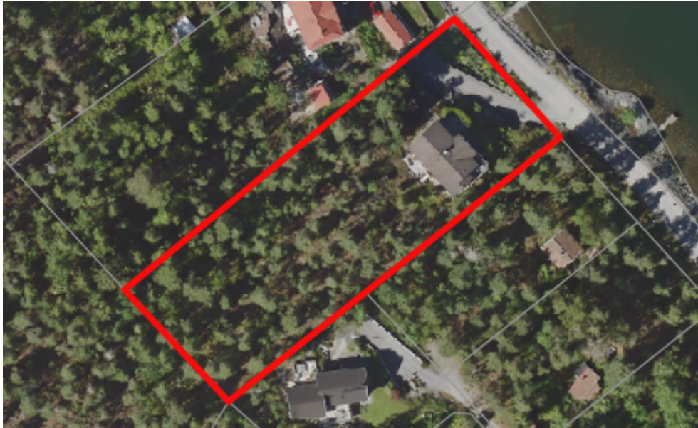
Figur 2. Den aktuella fastigheten markerad i röd färg.

Ägaren till fastigheten Strand 1:318 på Strandvägen 39 i kommundelen Strand inkom till kommunen i december 2020 med en förfrågan att ändra detaljplanen för att möjliggöra en styckning av fastigheten och uppföra ett enbostadshus i souterräng (se figur 3). Komplettering begärdes av den sökande där det framgick hur angöring var tänkt att anordnas samt hur bebyggelsen skulle placeras inom den tänkta fastigheten. I kompletteringen framgick det att den befintliga skaftvägen inom fastigheten Komministern 6, söder om Strand 1:318 föreslås förlängas för att möjliggöra angöring till den tänkta fastigheten.