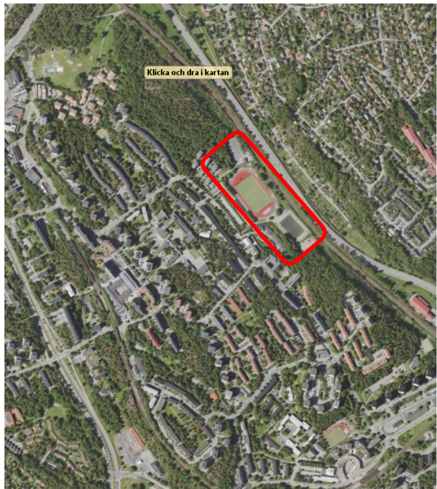
Satellitbild över Hagsätra IPs geografisk placering inom Hagsätra.

På Hagsätra IP finns en 11-spelsplan (A-plan), rundbana, hoppgröpar och segment för kula, basketkorgar samt utegym. Därtill finns rester av en tidigare isrink. Intill A-planen finns läktare samt en servicebyggnad med omklädningsrum för idrottsutövare och domare samt föreningsutrymmen och garage.