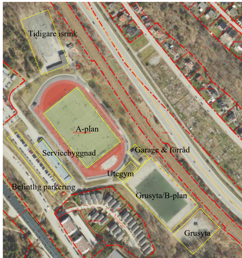
Översiktsbild på befintliga funktioner på Hagsätra IP.