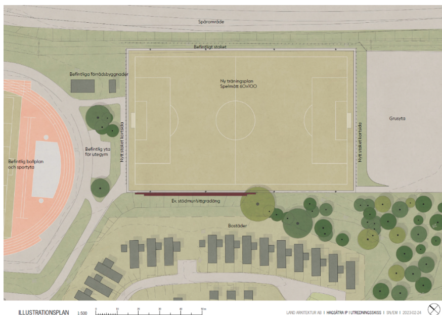
Illustrationsplan som visar placering av den nya bollplanen.

Fastighetskontoret Fastighetsavdelningen