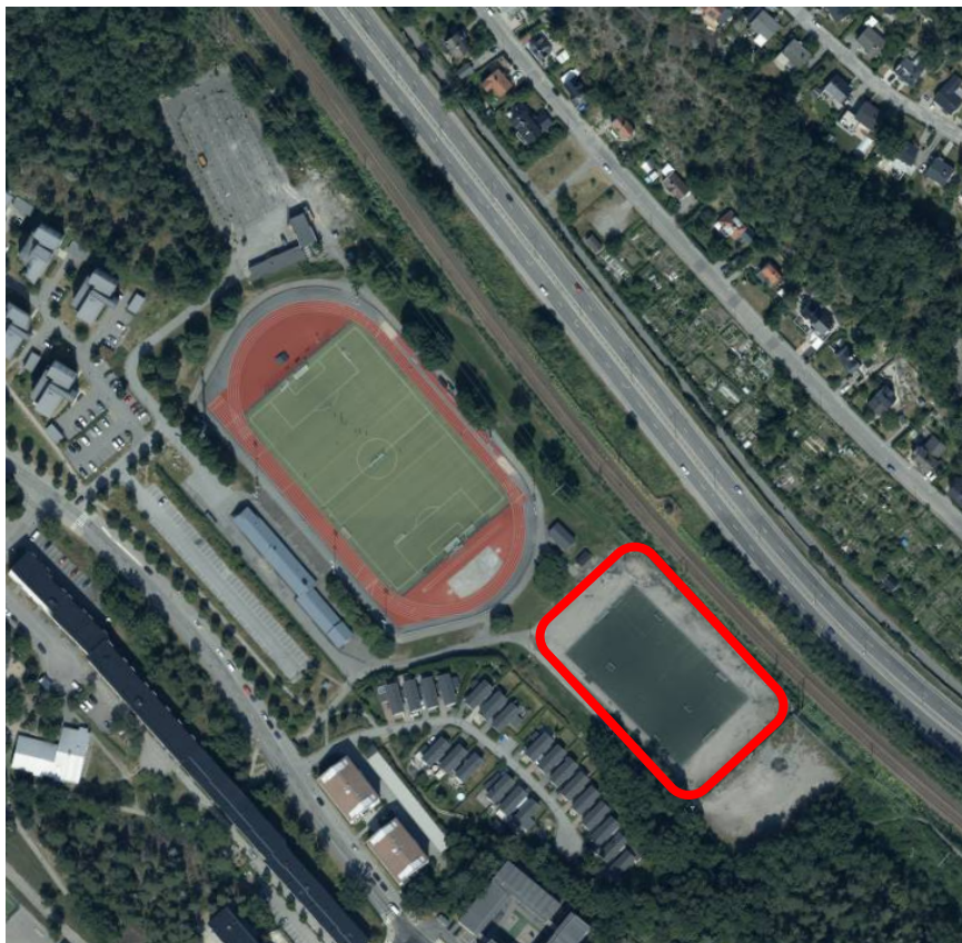
Översiktsbild, röd markering visar placering av ny konstgräsplan.