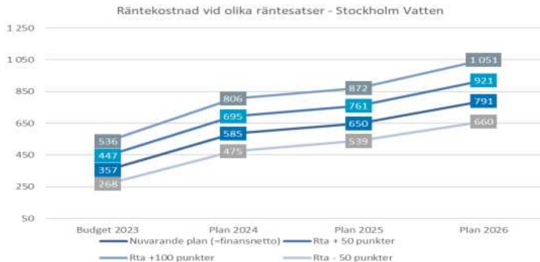
Figur 3. Simulerad årlig räntekostnad för Stockholm Vatten vid olika ränteutvecklingar relativt vad som antagits i flerårsplan 2024-2026 (=nuvarande plan)

I figuren framgår det t ex att om den genomsnittliga räntan ökar med 1 procentenhet (100 punkter) under 2025 jämfört med den antagna nivån samma år (3,0 %) så stiger kostnaden för Stockholm Vatten med 222 mnkr (från 650 mnkr till 872 mnkr), förutsatt att övriga kostnader inte påverkas (dvs 'allt annat lika'). Det skulle kräva en motsvarande höjning av de taxebaserade intäkterna (samt priser mot grannkommuner) med runt 8 procentenheter för att de ökade räntekostnaderna skall kunna finansieras av motsvarande avgifter.