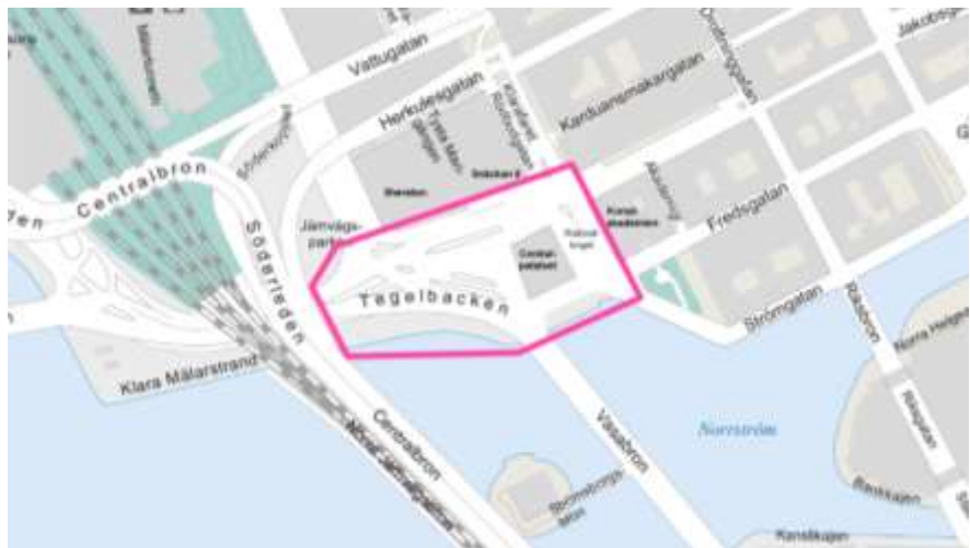
Figur 1. Markerat område inom vilket Tegelbacken och Rödbotorget kommer att omgestaltas.

Nämnden fattade 2023-06-08 ett inriktningsbeslut för program för ersättningsinvesteringar avseende medelstora åtgärder i byggnadsverk 2023-2026 (Dnr T2023-01307). Tätskiktsbytet på betongkonstruktionerna vid Tegelbacken avses genomföras inom ramen för detta program.