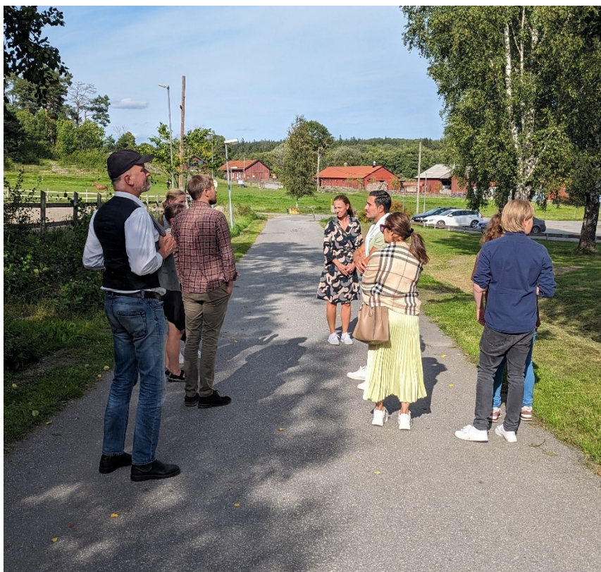
Enhetsdag med besök i Alby friluftsområde