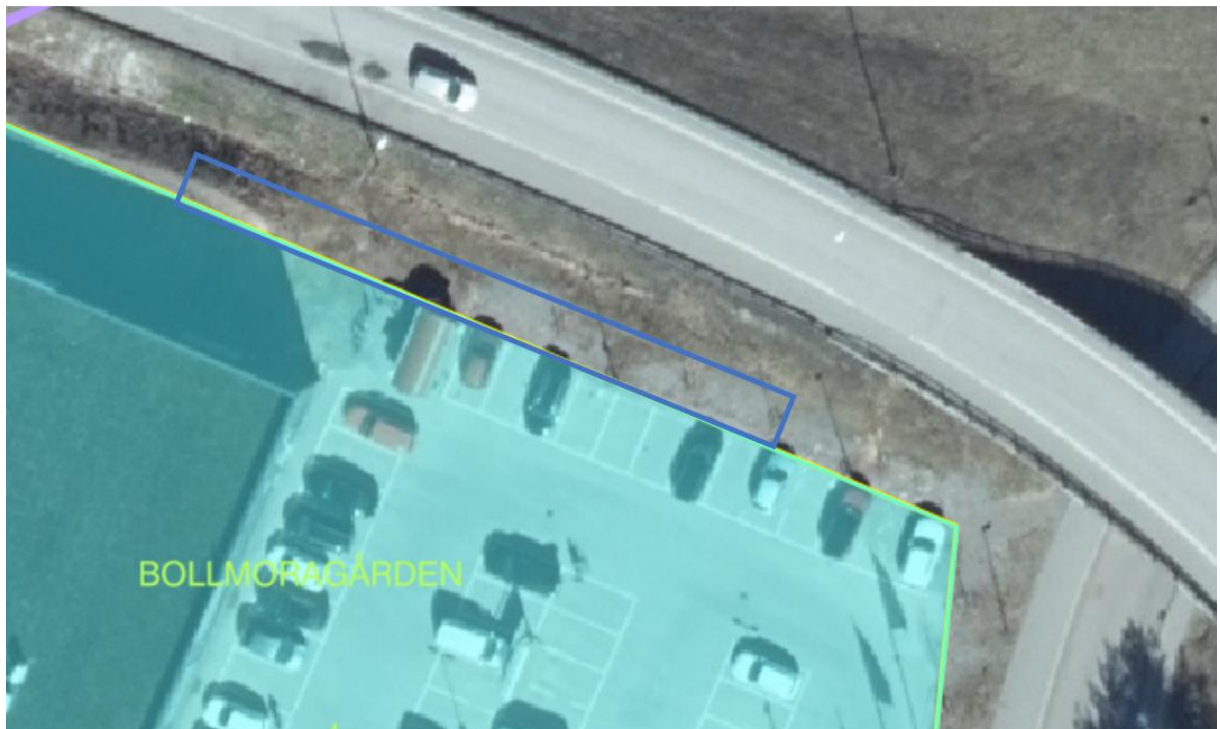
Bild 2 Översiktskarta av laddstationernas placering