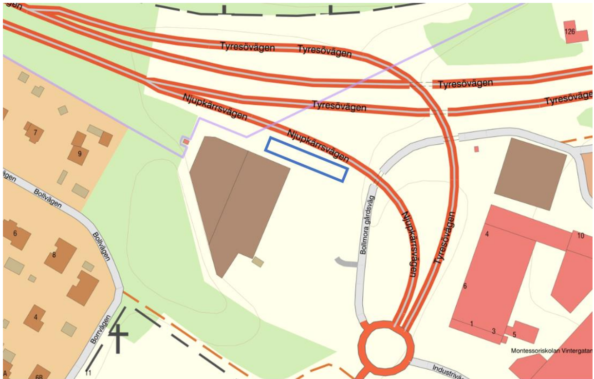
Bild 1 Översiktskarta av laddstationernas placering