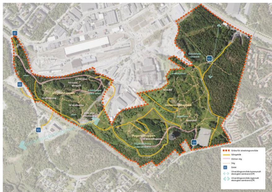
Kartbild 4, se bilaga 2 för större bild. Utredningsområdet som definierats samt befintliga stråk, kopplingar och aktiviteter.

På kartbild 4 redovisas befintliga stråk och kopplingar inklusive körbara vägar. Det finns ett flertal naturstigar i området, en del asfalterade och grusade gångstråk samt enstaka körbara vägar. Det saknas ett sammanhängande gångvägsnät. Bristande kopplingar beror delvis på utveckling av intilliggande industrier samt på stora nivåskillnader. Flera av de stigar som finns är upptrampade. Bristen på körbara vägar innebär svårigheter för drift och underhåll av områdena men även möjlighet för byggnation/anläggning. Den enda parkeringen i området tillhör Stockholm BMX-arena. Det är bristande koppling till spårbunden kollektivtrafik från Högdalen på grund av pågående byggnationer. Busshållplatser finns i närheten.