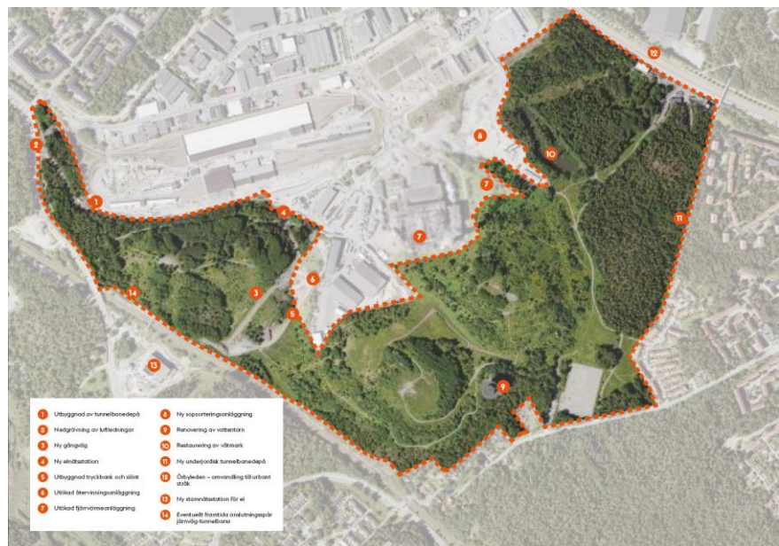
Kartbild 6, se bilaga 4 för större bild. Pågående och planerade byggnationer i området.

SL/Trafikverket utreder hur järnvägsnätet och tunnelbanenätet kan kopplas ihop. Den här platsen är ett av alternativen som utreds.