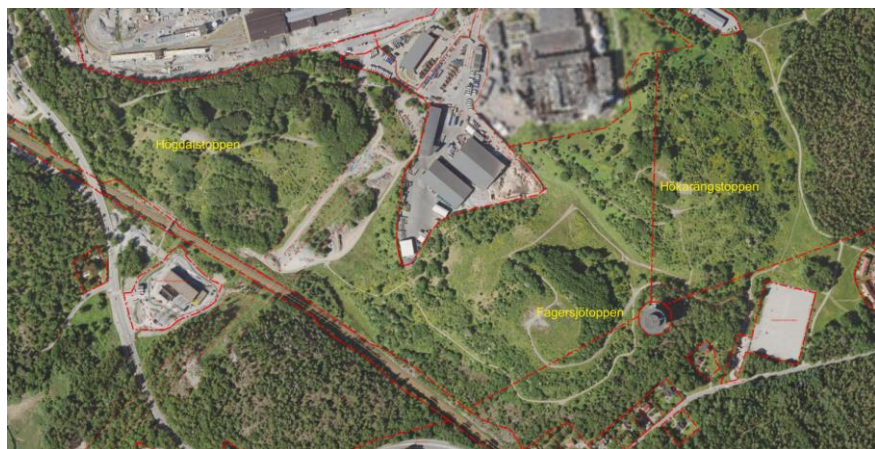
Kartbild 2 och 3. Högdalstopparnas läge i Stockholm samt hur de olika topparna ser ut via ortofoto.