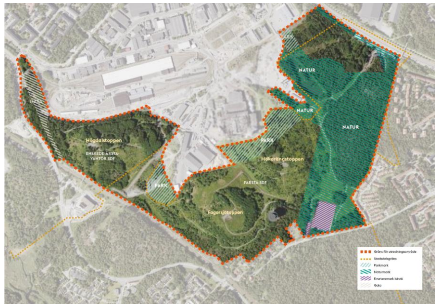
Kartbild 5, se bilaga 3 för större bild. Markanvändning i gällande detaljplaner. Högdalstopparna är till stor del inte detaljplanelagt.

Området kring Högdalstopparna är ofta belastat med illegala boplatser, vilket delvis påverkar möjligheten för allmänheten att nyttja området samt attraktiviteten av att göra det. Att avlägsna illegala boplatser tar mycket tid och resurser från staden och inblandade myndigheter. När staden ska avlägsna boplatser inom mark som inte är detaljplanelagd sker det genom att exploateringskontoret skickar en ansökan om särskild handräckning till Kronofogden. Om marken där boplatserna är belägna är allmän plats i detaljplan sker avlägsnandet istället genom att stadsdelsnämnden gör en polisanmälan och att polisen sedan avlägsnar de boende med stöd av ordningslagen. Efter att avlägsnandet skett dröjer det normalt inte länge innan boplatserna blir besatta igen.