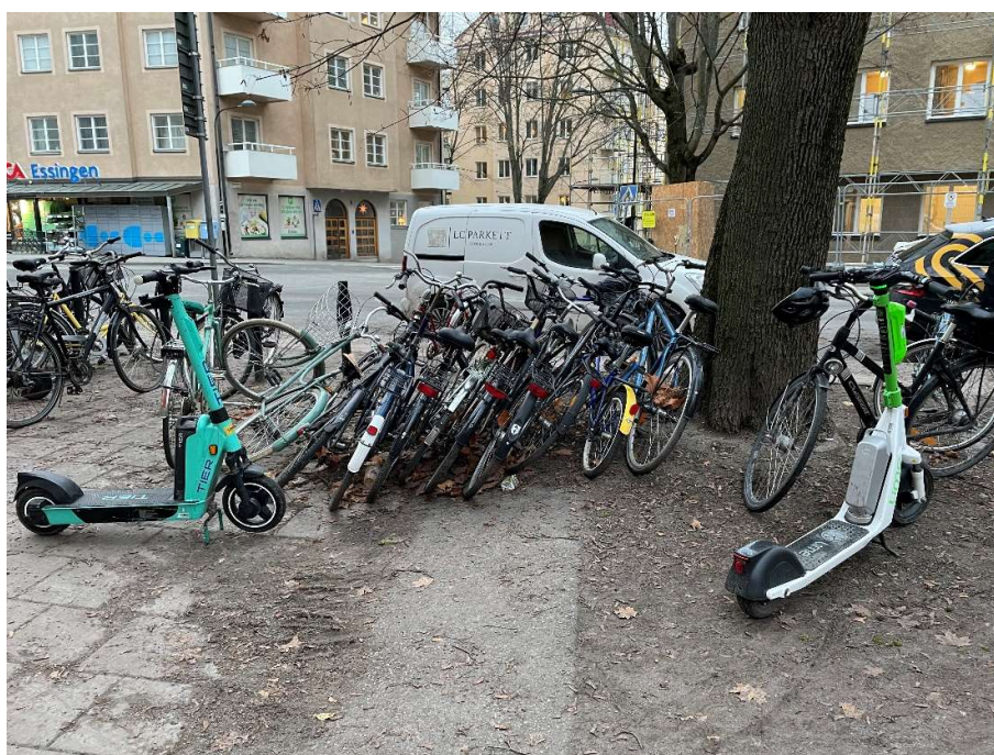
Befintlig situation, december 2022