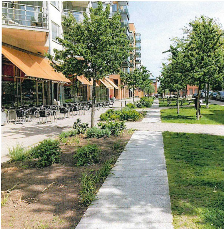
Befintlig situation, juli 2022

Bygghandlingar för upprustning av Luxparkens parktorg togs fram under 2022 med en finansiering genom så kallade Gatugröna medel.