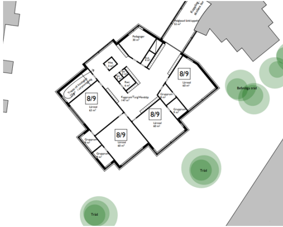
Skola plan 200