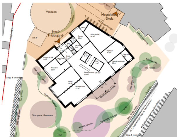
Fritidsgård plan 100 med ny skolgård del för äldre elever