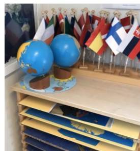
Exempel på Montessoripedagogiskt material inom området kultur

I den dokumenterade rutinen för arbetet med modersmål presenteras förskolans ställningstaganden och arbetsmetoder. Rektor anger att arbetet integreras i den pedagogiska verksamheten, exempelvis genom att erbjuda barn att höra berättelser på sitt modersmål med hjälp av en digital bilderbokstjänst, eller att pedagogerna lär sig exempelvis ord, fraser och sånger på aktuella språk. Inom det Montessoripedagogiska området kultur ingår arbetet i förskolans läroplan kring att lägga grunden till barnens förståelse för olika språk och kulturer. Alla ämnen inom kulturområdet börjar som sensoriska övningar, exempelvis så har förskolan en jordglob där barnen kan känna skillnaden mellan land (skrovligt) och vatten (slätt). Olika länder representeras med så kallade kulturlådor där barnen till exempel kan finna bilder på människor, föremål och flaggor. I materialet synliggörs även svenska minoritetsspråk och samernas livsvillkor. I arbetet med modersmål och kultur används QR-koder tillsammans med landets flagga så att barnen själva kan scanna en kod för att kunna höra hälsningen ”hej” på landets språk.