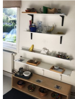
Exempel på material som placerats högt upp

Observationerna visade att barnen hade god kännedom om materialet i lärmiljöerna och dess användningsområden. En stor del av lek- och lärandematerialet är tillgängligt i barnens höjd, men det finns också synligt material som är placerat högt upp. En stor del material är framdukat på brickor eller i lådor, vilket underlättar för barnet att ta fram materialet respektive plocka undan det när de har arbetat färdigt. Den skapande verksamheten