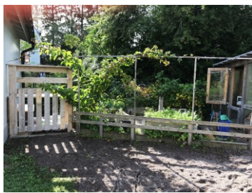
Plats för odling på förskolans gård

Klintens gård bjuder in till varierade aktiviteter. Gården har gräs, asfalt och stenplattor och det finns ett flertal fasta lekinstallationer så som gungor,