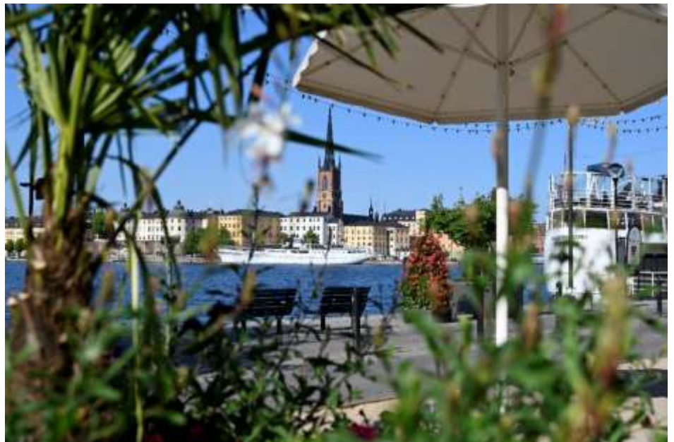
Bild 4, sommarkaj med grönska i förgrunden.

Under 2024 har kontoret i uppdrag att öka inslaget av grönska vid aktivering av platser inom ramen för Levande Stockholms arbete. Växtligheten är redan en viktig del på sommar- och vinterplatserna, både i form av flor i blomsterurnor anpassade efter säsongen och träd i trädlådor. På vintern förekommer även granar och andra barrväxter. I de undersökningar som görs visar resultaten återkommande att grönska och växter är något av det som uppskattas allra mest av besökarna på sommarplatserna. Under året kommer kontoret se över hur grönskan på ett ännu tydligare sätt kan införlivas i Levande Stockholm.