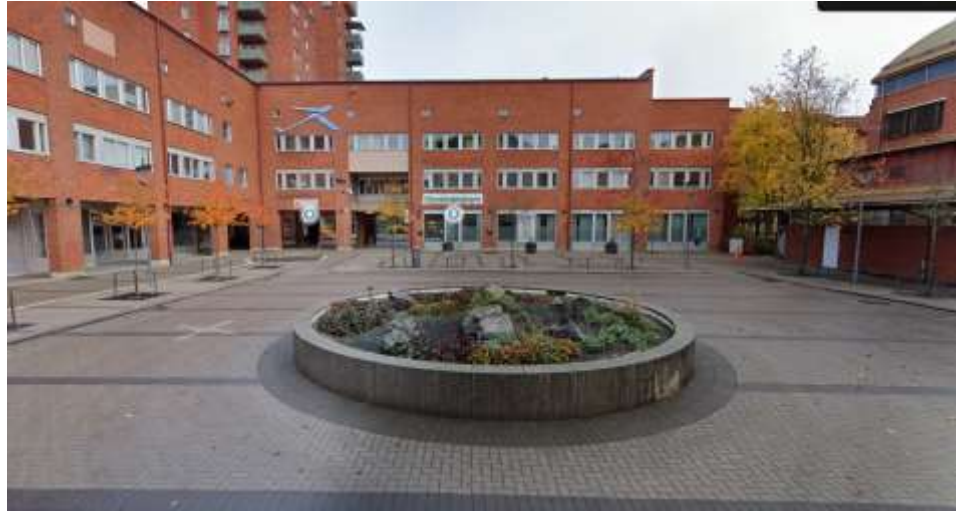
Bild 3, foto från Skarpnäcks torg.