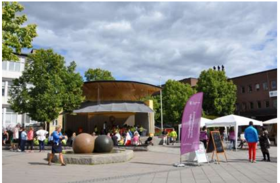
Bild 1, foto från Hässelby torg.

Hässelby torg är en nygammal plats som har funnits med inom Levande Stockholm tidigare. Både stadsdelsförvaltningen och kontoret ser att torget kan bli mer levande genom aktivering i form av både grönska, möbler och aktiviteter. Arbetet planeras att ske i nära samarbete med stadsdelsförvaltningen, som redan idag genomför satsningar på platsen under sommaren.