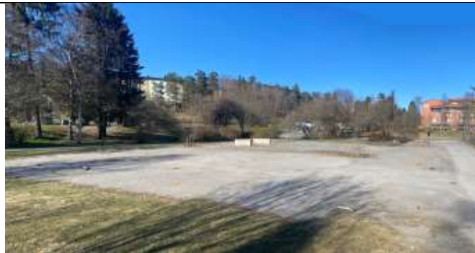
Tidigare foto över grusytan