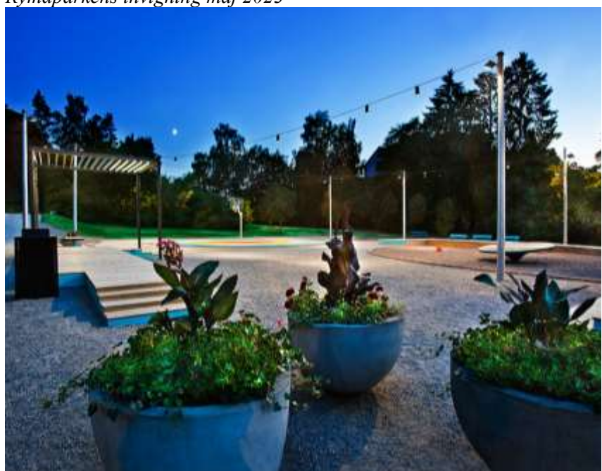
Foto på rymdparken nattetid