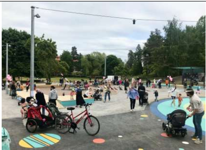
Rymdparkens invigning maj 2023