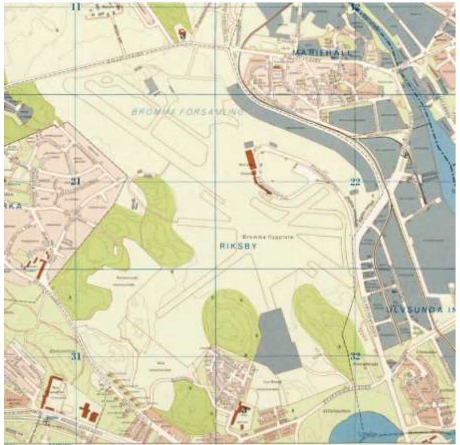
1972 års karta över Bromma flygplats.