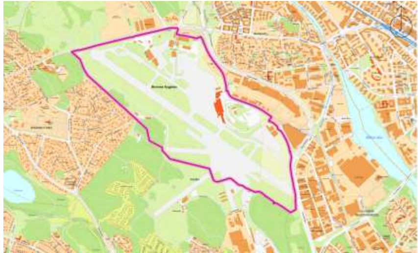
Bild 1. Arrendeområdet.

samordning som kommer att krävas på flera plan: med regionen, staten, stadens samtliga förvaltningar, intressenter, fastighetsägare och sakägare.