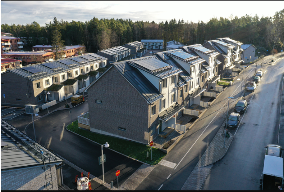
Figur 2: Bild från Kryddvägen etapp 2