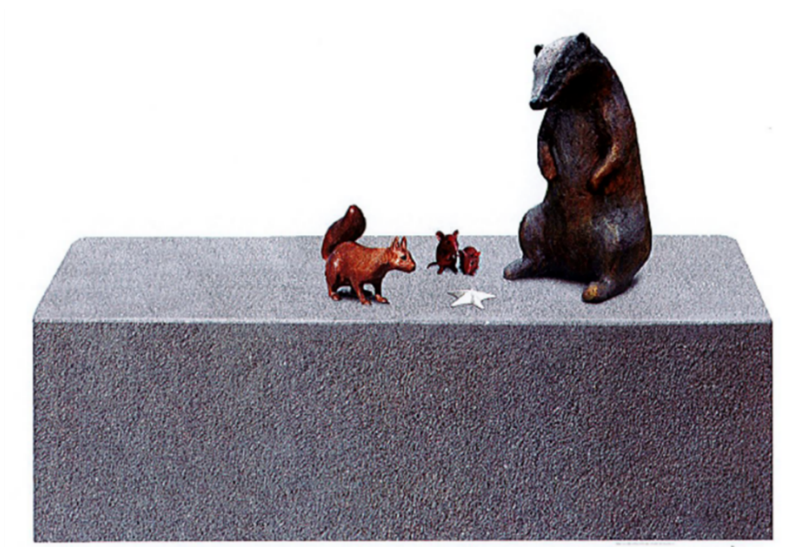
Figur 3: "Förundran" av Eva Fornåå