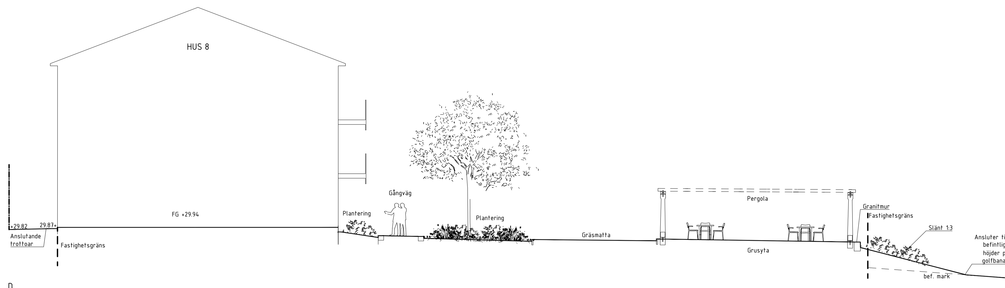
D SEKTION D-d Skala 1:100/A1, 1:200/A3