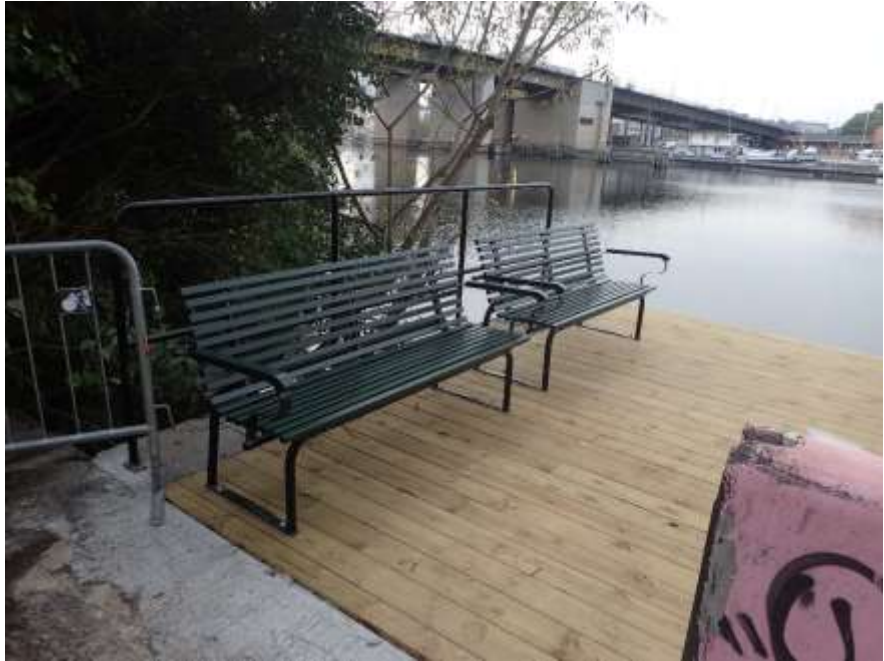
Bild 4 Fotografi som visar Kaj 57 efter renovering.