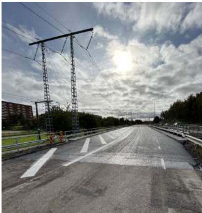
Bild 1 Fotografi som visar vy över bro Akallalänken söder om Finlandsgatan efter att ny beläggning lagts.

Befintligt tätskikt på två broar längs Akallalänken var i dåligt skick och behövde bytas ut. I samband med tätskiktsbytet utfördes även andra arbeten för att åtgärda skador på broarna, bland annat blästring och målning av räcken, reparation av underliggande pelare samt utbyten av skadade räcken. Arbetet utfördes i sin helhet under 2023 men slutbesiktning av pelarreparationerna är planerad i januari 2024. Den totala utgiften för åtgärden uppgick till ca 5 mnkr. Nedan visas bild efter projektets utförande.