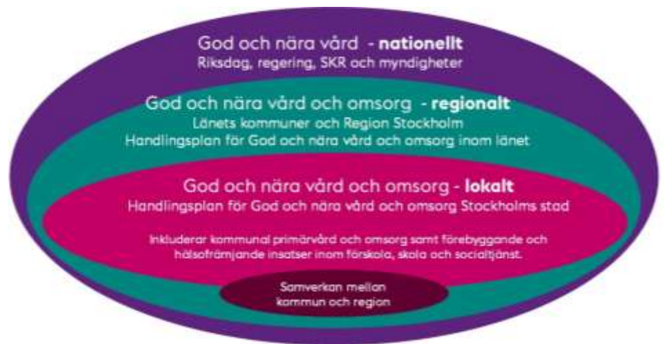
Figur: God och nära vård och omsorg – ett arbete på flera nivåer

Organisationen för samverkan, såväl regionalt som lokalt beskrivs mer utförligt i Huvudöverenskommelsen om länsövergripande samverkan kring hälsa, vård och omsorg (HÖK) 9 .