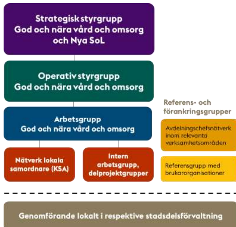
Figur: Organisation för God och nära vård och omsorg i Stockholms stad

Arbetet med att genomföra omställningen mot en god och nära vård och omsorg kräver ledning och samverkan på flera nivåer. För att arbetet ska utvecklas har följande organisation för genomförandet skapats.