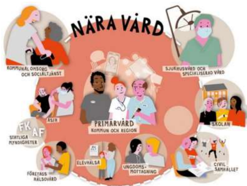
Figur: Verksamhetsområden inom god och nära vård, Källa: SKR, Presentation Nära vård

Figuren nedan är framtagen av SKR och beskriver exempel på olika områden som god och nära vård och omsorg kan innefatta. Både verksamhetsområden som kommunen och regionen är huvudman för, men även civilsamhällets aktörer som är en viktig samverkanspart i arbetet.