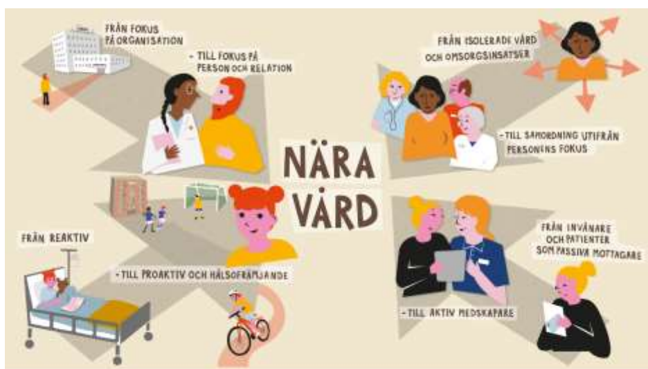
Bild: Nära vård handlar om förflyttning i förhållningssätt

Bilden nedan är framtagen av Sveriges kommuner och regioner (SKR) och visar på den förflyttning i förhållningssätt som en god och nära vård innebär.