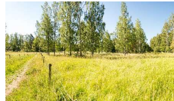
Ängsmark i Sätterskogens naturreservat