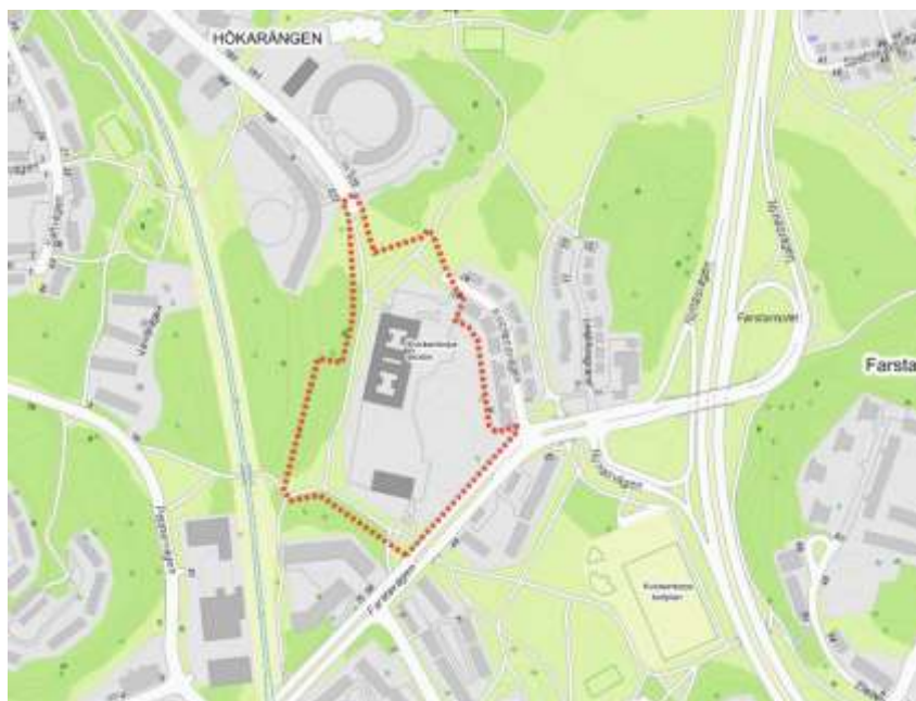
Projektområdet markerat med röd streckad linje. Projektet ligger främst inom stadsdelen Farsta men tangerar även Hökarängen. I norr syns Lingvägens och i söder Farstavägen.

För att möjliggöra för att nå ny bebyggelse i projektområdet föreslås en ny vägkoppling ifrån Farstavägen.