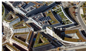
Ekologisk kompensationsåtgärd med gröna tak i Albano