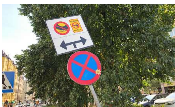
Dubbdäcksförbud och miljözon