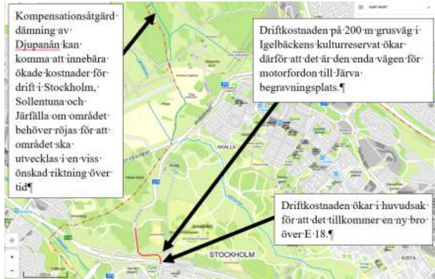
Figur 4. Karta över området som visar de viktigaste faktorerna som bidrar till att trafiknämndens driftkostnader ökar i samband med att projektet genomförs.

Den årliga ökade driftkostnaden bedöms uppgå till cirka 100 000 kr per år i 2024-års penningvärde på grund av att mängden väg ökar samt därför att det kommer att krävas mera skötsel i den del av reservatet där dämningarna placeras.