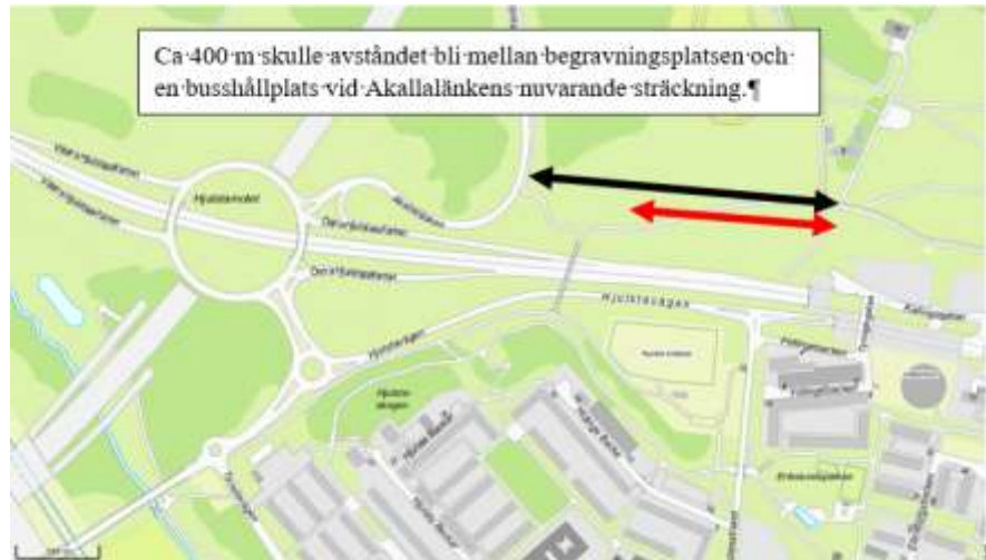
Figur 2. Karta över området. Idag är avståndet mellan begravningsplatsens entré och närmaste busshållplats 400 m. Att flytta södra Akallalänken innebär att avståndet kortas ned till 250 m enligt röd markering.