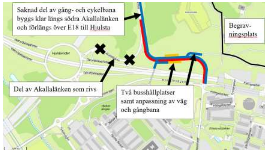
Figur 1. Karta över området. Föreslagna åtgärder markeras med blått, gult och rött streck. Den nya sträckningen för södra Akallalänken (röd markering) behöver tillägg vilka betjänar dem som cyklar, går och reser med kollektivtrafik till begravningsplatsen. Tillägg för dem som cyklar och går samt anpassning av befintlig väg visas med blå markering och busshållplatser med placering enligt orange markering. Järva begravningsplats öppnar under 2024.

Trafikverkets och stadens åtgärder innebär ett intrång i Igelbäckens kulturresevat. Trafikverket har ansökt om reservatstillstånd för samtliga åtgärder. Staden kommer att få bekosta sin del av vägprojektet samt en del av kompensationsåtgärderna föranledda av intrånget. Kompensationsåtgärderna är beslutade av stadsbyggnadsnämnden 2024-01-25 i ärendet Reservatstillstånd för flytt av södra delen av Akallalänken i Igelbäckens kulturresevat, Dnr 2019-15337-55.