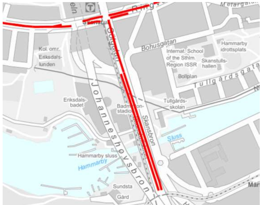
Figur 2, Översiktsskarta med befintliga busskörfält på Skanstullsbron markerade i rött.

På Skanstullsbron finns befintliga busskörfält på de sträckor där det är två körfält i respektive riktning, se figur 2. I början och i slutet på Skanstullsbron finns endast ett körfält i respektive riktning och utrymme saknas för att bredda körbanan på grund av konstruktionens utformning och befintliga bropelare. För att även fortsättningsvis göra det möjligt för övrig trafik att trafikera dessa sträckor föreslås inga busskörfält här.