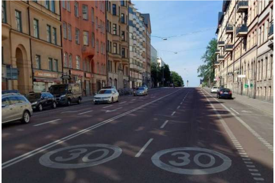
Figur 4, Hornsgatan mellan Ringvägen och Ansgariegatan.