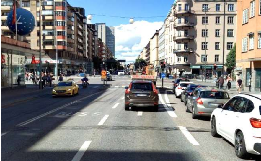
Figur 3, Götgatan i norrgående riktning, inför korsningen med Ringvägen.