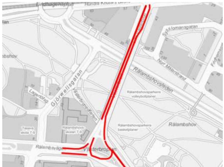
Figur 5, Översiktsbild över Västerbroplan och Lilla Västerbron, med befintliga busskörfält markerade i rött.

Vid Västerbroplan och på Lilla Västerbron finns idag befintliga busskörfält i båda riktningar, men med uppehåll vid korsningspunkter för att möjliggöra svängrörelser. Busskörfälten fortsätter direkt efter korsningspunkterna. Trafikkontoret föreslår inga busskörfält på dessa sträckor.