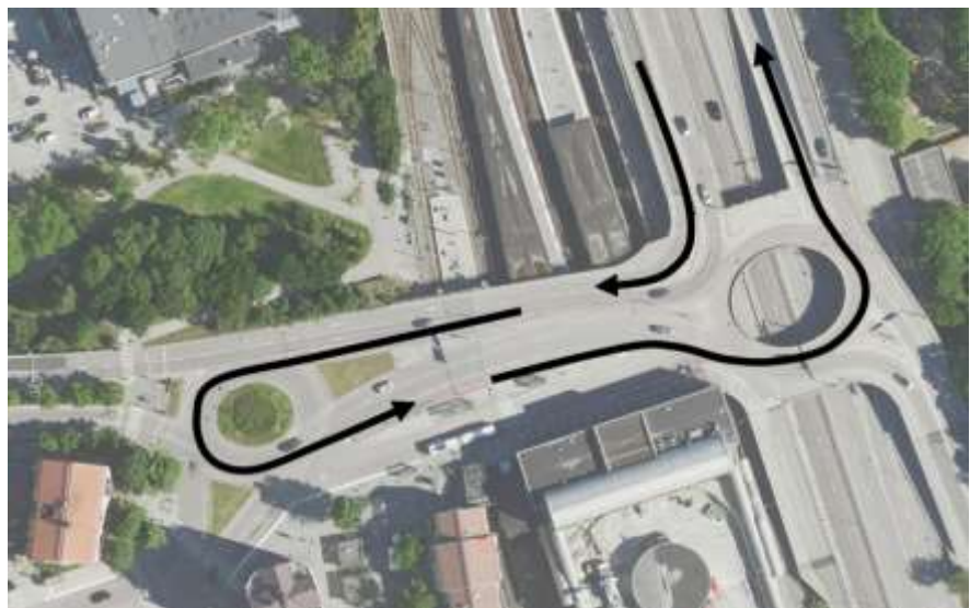
Figur 1, Ortofoto där färdvägen för stomlinje 4 är markerad med svarta pilar.

Vid Gullmarsplan kör stomlinje 4 från Skanstullsbron söderut och svänger sedan höger i Johanneshovsmotet, se figur 1. Stomlinjen svänger runt i cirkulationsplatsen där Johanneshovsvägen och Gullmarsvägen korsas och svänger in till busshållplatserna på Gullmarsplans norra sida. Efter hållplatsstoppet svänger stomlinje 4 vänster i Johanneshovsmotet och fortsätter norrut på Skanstullsbron. Svängrörelserna och växlingen från höger till vänster körfält efter Johanneshovsmotet gör det svårt att anlägga busskörfält på denna sträcka.