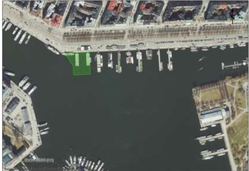
Karta 2: Område (markerat i grönt) som är aktuellt för upplåtelse i andra hand.