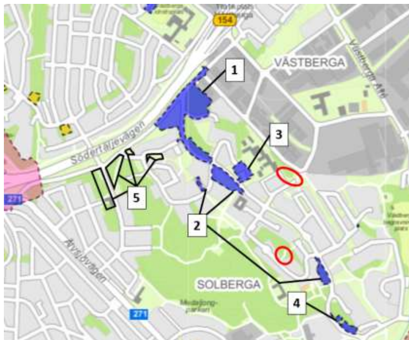
Figur 2. Pågående detaljplaner markerade i blått. Markanvisat men ännu ej planstartat område inom svart markering. Se Tabell

I stadsdelen pågår fyra detaljplaneprocesser för bostäder, se Figur 2 och Tabell 1. Ett område (nummer 5 i figuren) markanvisades i september 2024 för Stockholmshus till AB Familjebostäder.