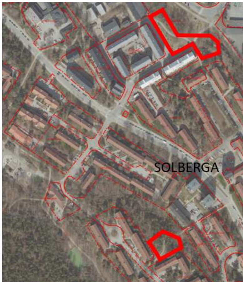
Figur 3. Otrofoto med markanvisningsområdet markerat med röd begränsningslinje.

Exploateringen innehåll och utformning kommer att prövas i planprocessen.