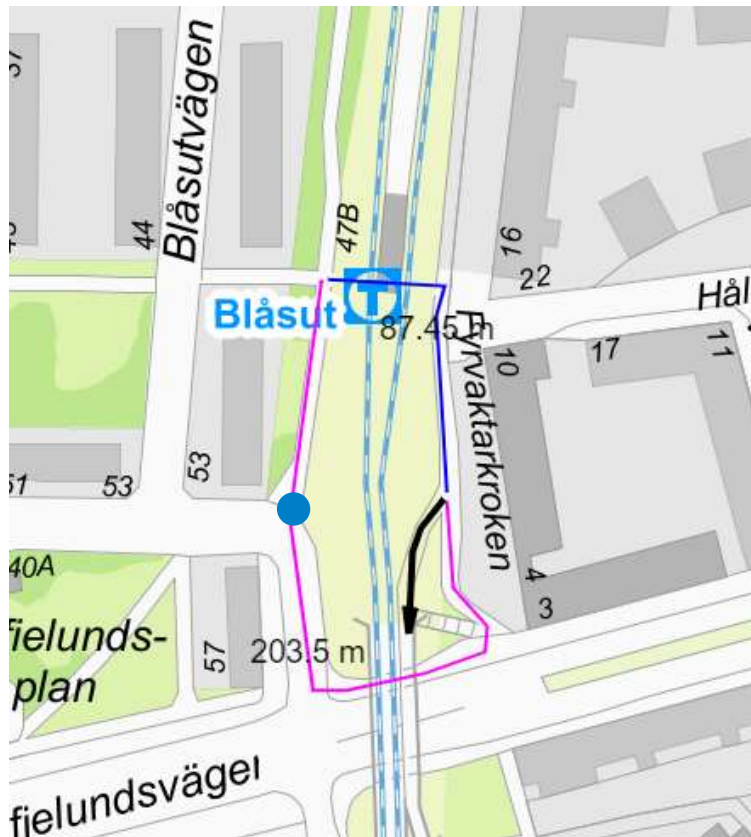
Figur 4. Nuvarande ledning av cykeltrafiken (blå) samt omledning utan möjlighet att använda koppling via tunnel (rosa).

Trafikkontoret har nyligen sänkt kantstenen i nordöstra hörnet av Sofielundsplan (blå punkt i Figur 4) vilket ska kunna avleda en del av den cykeltrafik som cyklar söderut längs den gröna sträckan (se Figur 1) att cykla rakt söderut mot Sofielundsvägen istället genom tunneln förbi tunnelbanan.