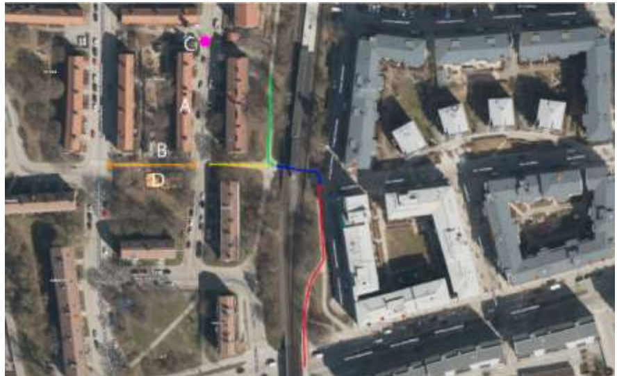
Figur 1. Karta över området med markeringar.