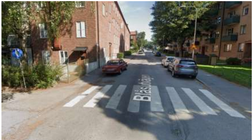
Figur 5. Situation utanför förskola med övergångsställe och farthinder.

meter bort vid förskolans huvudentré samt farthinder, dessutom är den här delen av Blåsutvägen enkelriktad vilket också bidrar till relativt lågt trafikflöde på platsen (se Figur 5). Dock så strävar kontoret efter att trafiksäkerheten ska vara hög i hela staden. För att det ska bli aktuellt ska den berörda sträckan ha höga trafikflöden och/eller att trafikmätningarna ska visa höga hastigheter. Kontoret har inga trafikmätningar för Blåsutvägen, dock har närliggande jämförbara gator låga flöden på runt 200 fordon/dygn och i liknande områden är även hastighetsefterlevnaden relativt god. Trafikkontoret kommer utföra en trafikmätning på berörd sträcka för att se över trafikflöden och hastigheter under våren 2025. Beroende på utfall i trafikmätningen kommer kontoret ta ställning till kompletterande åtgärder.