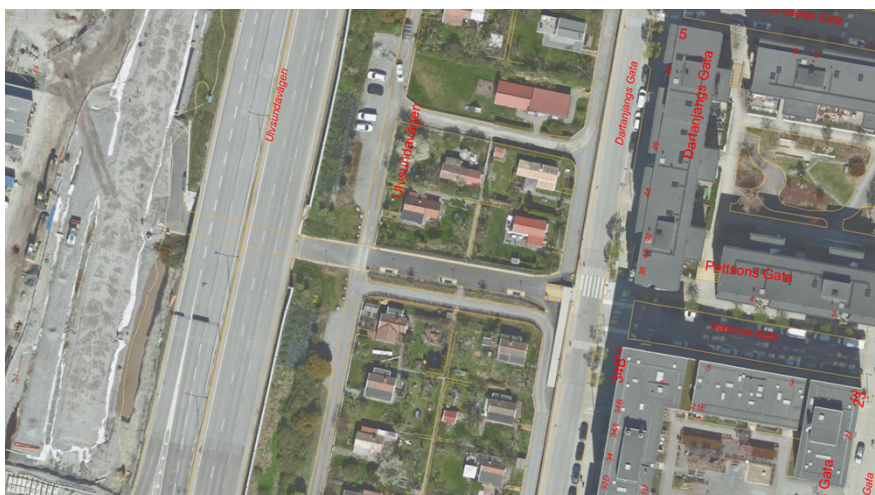
Figur 4. Flygfoto över Solvalla koloniområde och delar av Ulvsundavägen från 2024. Gångtunnelns läge samt det färdigställda gångstråket syns mitt i bild, i bildens vänstra del syns förberedande arbeten för projekt Tvärbanan Norra Kistagrenen.