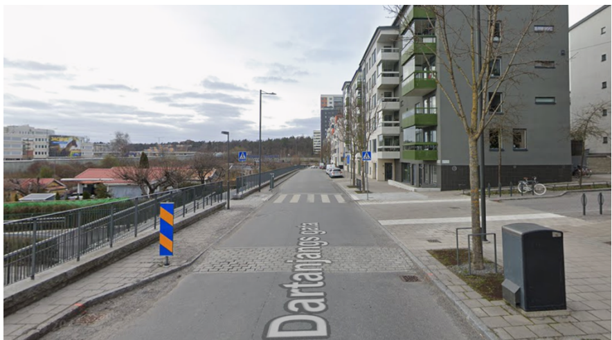
Figur 8. Fotografi som visar Dardanjangs gata norrut i höjd med Pettersons gata efter ombyggnad, övergångsställe med anslutande trappa och ramp mot koloniområdet.