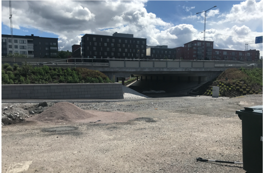
Figur 6. Fotografi taget sommaren 2022 av tunnelmynningen på Ulvsundavägens västra sida i riktning mot Annedal. På platsen pågår arbete med Tvärbanan Norra Kistagrenen.