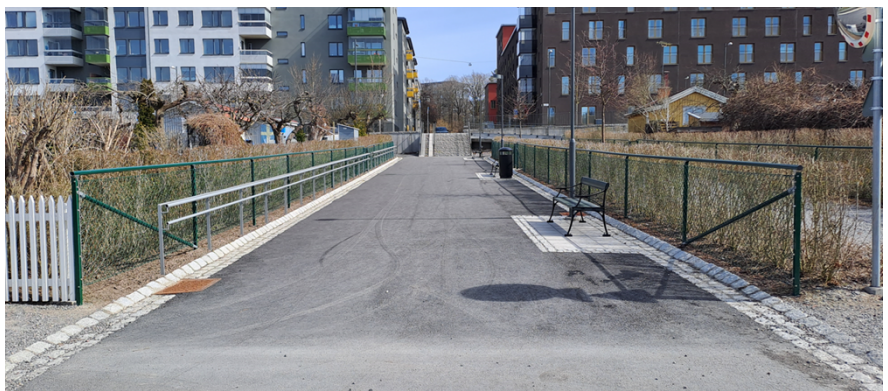
Figur 11, Fotografi som visar koloniområdet österut upp mot Dartanjangs/Pettsons gata efter anläggande av gångstråket.