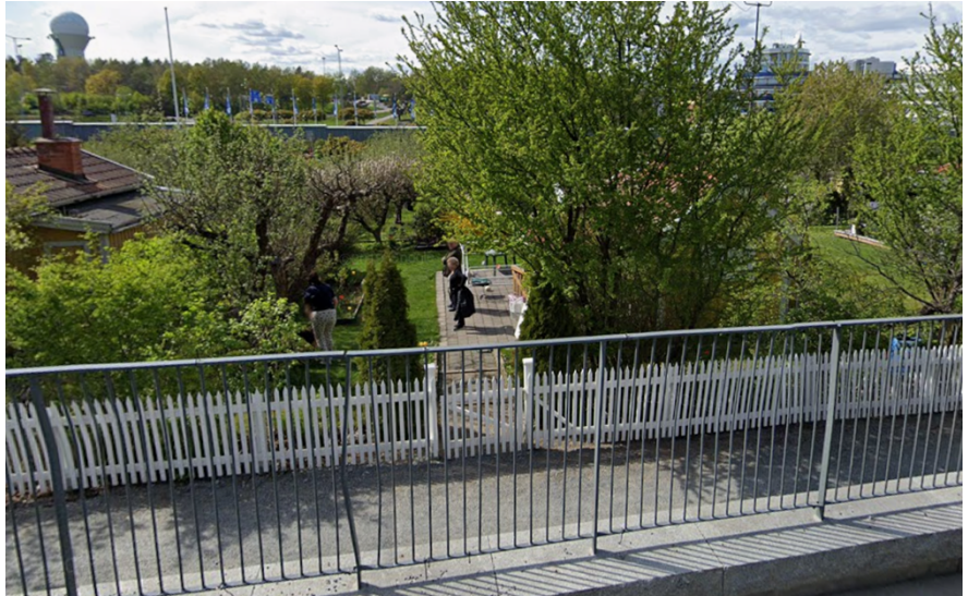
Figur 9, Koloniområdet västerut mot Ulvsundavägen före anläggande av gångstråket.