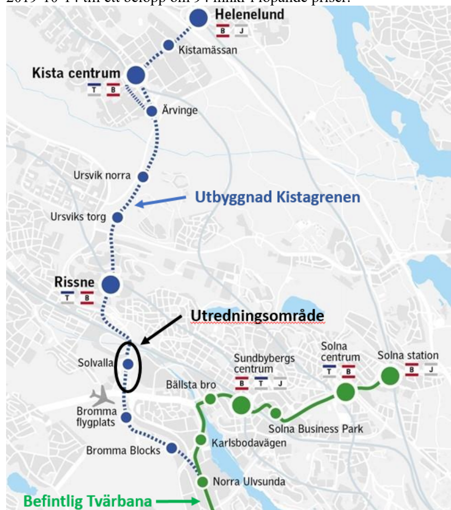
Figur 1. Översiktsskarta med Tvärbanan Norr Kistagrenens planerade sträckning från Bromma till Helenelund markerad med blått. Utredningsområdet inom vilket en koppling mellan Annedal och Solvalla utretts markerat med svart och befintlig tvärbana Solnagrenen markerad med grönt.

Den 6 april 2017 fattade trafiknämnden inriktningsbeslut (Dnr T2018-00945) för en gångtunnel mellan Annedal och Solvalla. Genomförandebeslut (Dnr KS 2019/920) fastställdes av kommunfullmäktige 2019-10-14 till ett belopp om 94 mnkr i löpande priser.