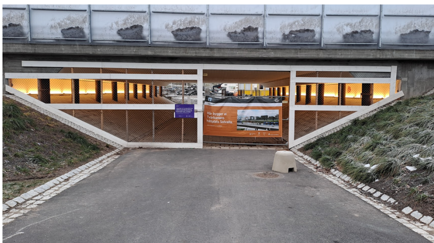
Figur 5. Fotografi taget hösten 2025 av den avstängda tunnelmyningen på Ulvsundavägens östra sida i riktning mot Solvalla.