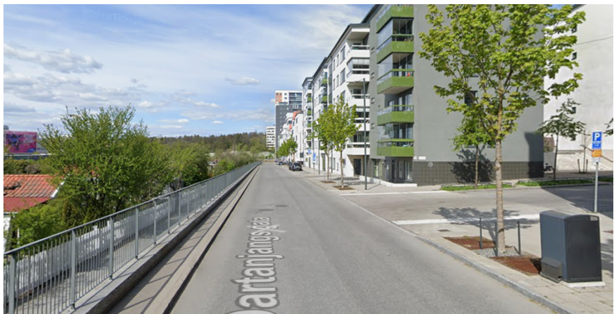
Figur 7. Fotografi som visar Dardanjangs gata norrut i höjd med Pettersons gata före ombyggnad, på platsen saknas anslutning mot koloniområdet.