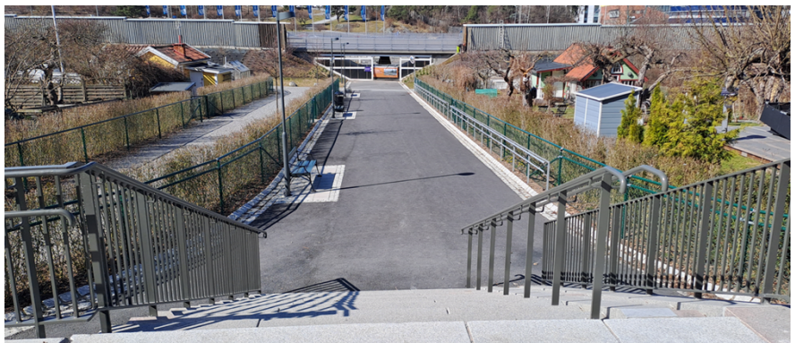
Figur 10, Fotografi som visar koloniområdet västerut mot Ulvsundavägen efter anläggande av gångstråket.