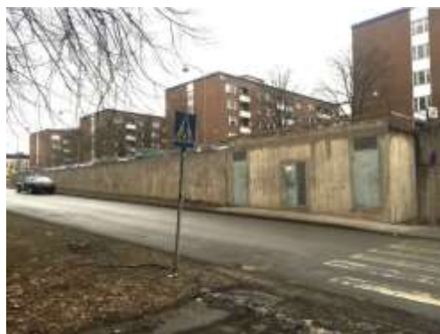
Stödmurens utseende innan konstverket monterats.

I nära samarbete med Stockholm Konst har en procent av stadens byggkostnad avsatts till offentlig konstnärlig gestaltning. Konstverket har namnet Längs en ny natur och är skapat av Mia E Göransson år 2020. Verket består av olika abstraherade landskapsvyer gestaltade på keramiska klinkerplattor monterade på en befintlig stödmur i betong längs med del av Rinkeby Allé, i höjd med polishuset på fastigheten Kvarnberget 9. Utspritt längs med klinkerväggen har små reliefer gjutna i metall monterats i vattenskurna håligheter. Konstnärens avsikt med verket var att ge stödmuren funktionen av en följeslagare som inbjuder till distraktion, undran, mystik och egna tolkningar.