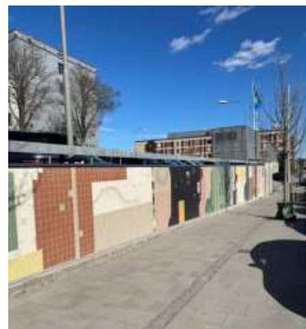
Stödmurens utseende efter att konstverket monterats.