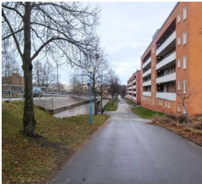
Fotografi, taget i december år 2013, över Rinkeby Allé innan ombyggnationen påbörjats.

I slutet av 2009 identifierades Rinkeby Allé och Rinkebyplan som ett viktigt utvecklingsområde i Rinkeby. Flera av stadens förvaltningar och bolag hade identifierat utvecklingspotential inom såväl kvartersmark som allmän platsmark.