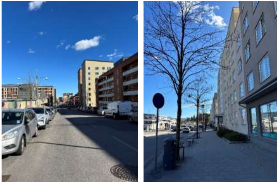
Fotografier, tagna i april år 2026, över Rinkeby Allé och Rinkebysvängen efter ombyggnationen.

Inom ramen för detta projekt har även exploateringsnämnden år 2015 beslutat om en markanvisning och överlåtelse av 213 kvadratmeter tillskottsmark från stadens fastighet Akalla 4:1 till AB Familjebostäder. Bolaget genomförde ett detaljplanearbete för ändrad användning till kontorsverksamhet och tillskottsmarken, som reglerades till den avstyckade fastigheten Kvarnberget 9, behövdes för att anlägga en extra infart till det befintliga garaget. AB Familjebostäder ägde fastigheten fram till år 2019. Hemsö AB förvärvade Kvarnberget 9 och slutförde projektet. Hyresgäst är Polismyndigheten med cirka 240 arbetsplatser sedan i slutet av år 2020.