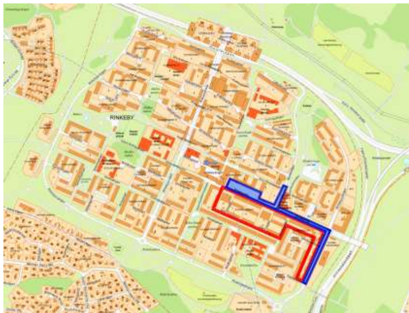
Karta över gatuombygnadsområdet (blått markerat område) och de tomträtts- och äganderättsfastigheter AB Svenska Bostäder utvecklat (rött markerat område).

Utifrån detta tog exploateringskontoret fram ett förslag till ombyggnad av Rinkeby Allé och utveckling av bostäder i angränsande områden tillsammans med AB Svenska Bostäder.