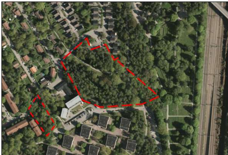
Figur 2: det område som markanvisades till Stockholmshem

Arbetet med en detaljplan för det markanvisade området påbörjades i december 2016. Planområdet omfattade ett grönområde som då var planlagt som parkmark. Området användes främst som gång- och cykelstråk mellan bostadsområden och som parkstråk längs Västberga begravningsplats.