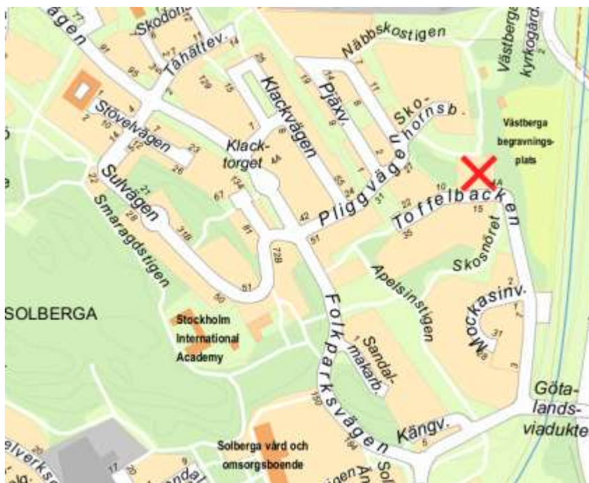
Figur 1: karta med projektets geografiska läge markerat i rött

AB Stockholmshem tilldelades i oktober 2016 en markanvisning för att uppföra cirka 200 hyresbostäder i flerbostadshus inom fastigheten Västberga 1:1 i Solberga. Bostäderna är en del av satsningen Stockholmshusen med målet att låta de allmännyttiga bolagen bygga hyresrätter med överkomliga hyror, god arkitektur och hållbarhet.