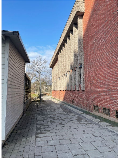
Område 2: Parkeringen.