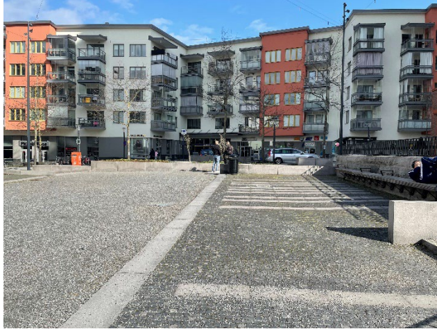
Område 4: Dolt hörn mellan Hemköp, kyrkan och parkeringen.