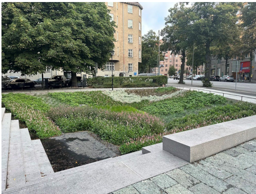
Figur 2. Bilden visar den nedsänkta torrdammen vid Jarlapan efter byggnationen.

Området bedöms även vara representativt för tätbebyggd, befintlig miljö med komplexa förutsättningar för åtgärdsarbete, vilket medför att resultatet från projektet kan appliceras på många framtida projekt.