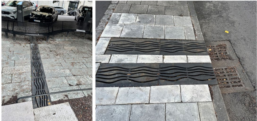
Figur 3. Bilderna visar skyfallsrännor och brunnar som leder in vattnet till skyfallsparken.