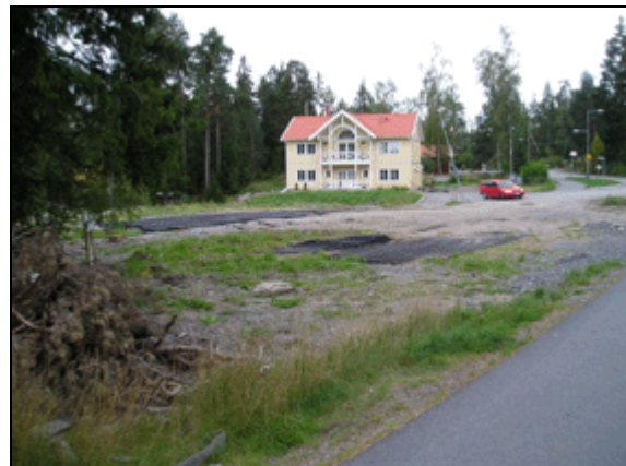
och ifrån norr.