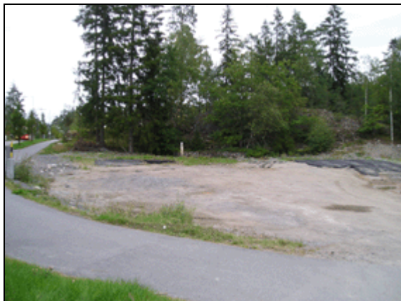
Foton på fastigheten, ifrån söder ...

Planen kommer att medge en byggrätt på ca 400 m 2 i två plan. Infart bör ske från Strandallén och parkering för personal och föräldrar anordnas inom fastigheten.