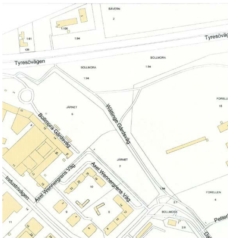
Bilden visar dagens fastighetsindelning inom och intill planområdet.

Planområdet omfattar fastigheterna Bollmora 1:94 och Bollmora 2:1 som ägs av Tyresö kommun. Del av Bävern 2 och Järnet 7 som är privatägd.