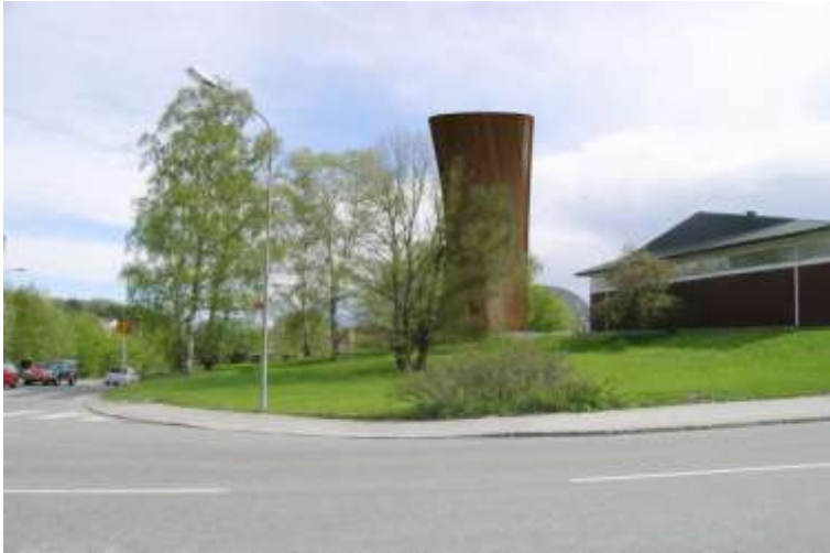
Avluftstorn vid Ryttsstadion, till höger syns gaveln på "röda ridhuset".

strider mot ett flertal miljömål, bl.a "frisk luft" och "begränsad klimatpåverkan". Det går inte att innehålla de bullergränser som gäller för områden för rörligt friluftsliv. Det är tekniskt möjligt att placera ventilationstornen på andra platser genom att bygga kulvertar. Tornen kan göras lägre. Stockholms brandförsvär anser att avluftningstornets höjd har inverkan på spridningsbilden i händelse av brand eller utsläpp av giftig gas.