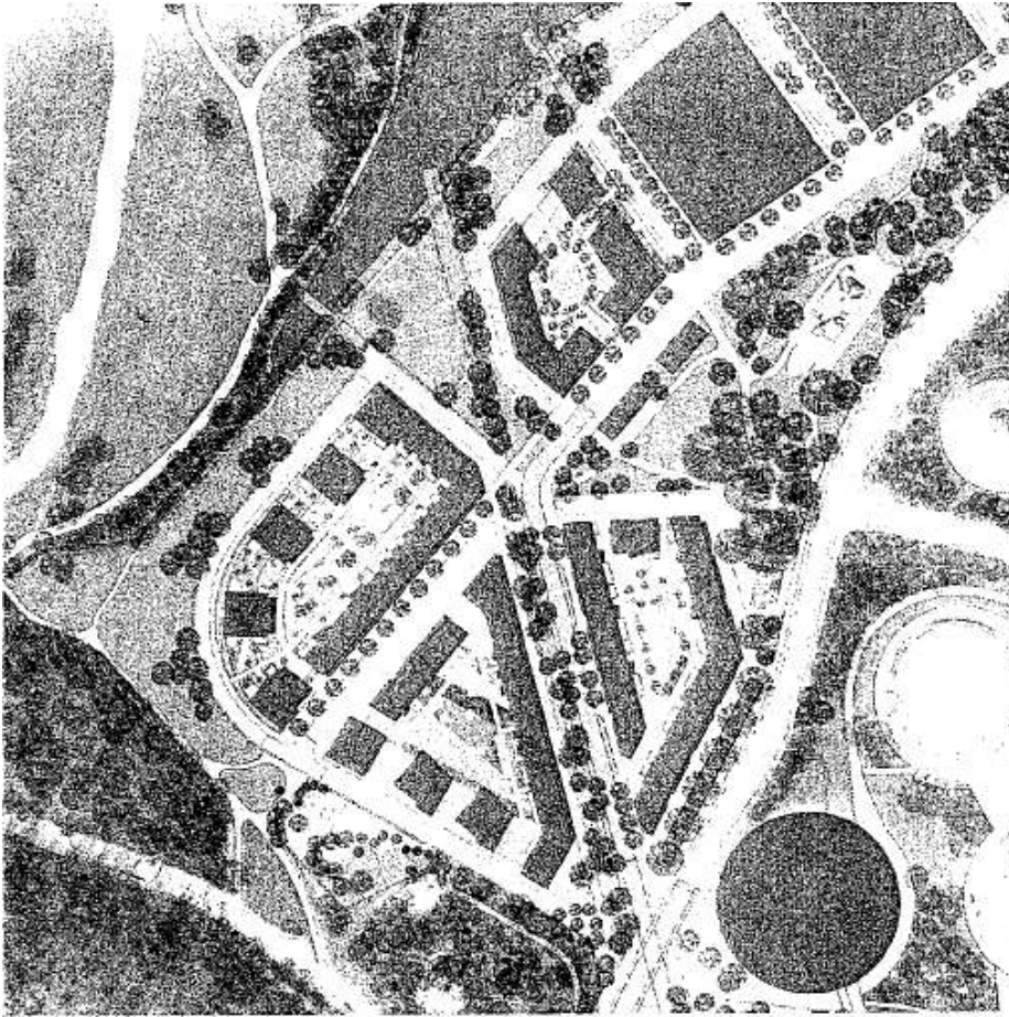
Illustrationsplan över planområdet