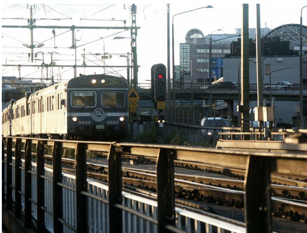
Pendeltåg X1, håller på att ersättas av X60.

X60 är namnet på SL:s nya pendeltåg som så småningom kommer att ersätta de äldsta pendeltågsvagnarna X1 och X10. Ett X60 fordon motsvarar ca två X1 eller X10 i längd. SL har beställt 71 st X60 vagnar. De första X60 togs i drift 2005 och de sista i denna omgång levereras 2008. Enligt de ursprungliga planerna skulle alla X1 vara tagna ur trafik i november 2008. Det ser nu ut kunna bli en viss försening av vagnsutbytet. X10 används enbart för insatstrafik. De nya tågen (X60) bedöms ha uppemot 8 dBA lägre ljudnivå än de äldre X1 och X10, vilket har verifierats vid mätningar. Över tidsperioden 2005 till 2008 har därmed bulleremissionen från pendeltågen minskat med upp till 8 dB. En del av förbättringen kommer dock troligen att uppvägas i takt med att de nya X60-tågen blir mer slitna. Jmf 6.2.3.