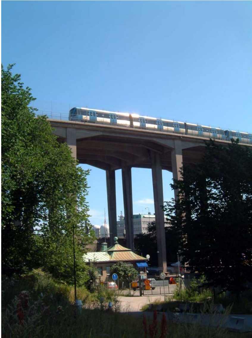
C20-tåg på väg över Skanstullsbron.

Nytt signalsäkerhetssystem infördes 1998 på gröna linjen. Systemet innebär färre rälskarvar, vilket bl a innebär att antalet slag vid skarvpassager minskar. Dessa orsakar höga bullernivåer och reduktionen har minskat bullerstörningen.