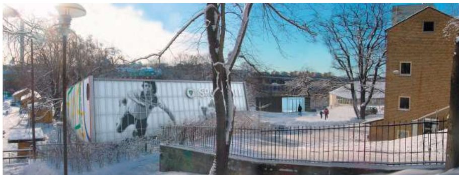
Förslag till utformning av Skanstullshallens fasad mot Bohusgatan.