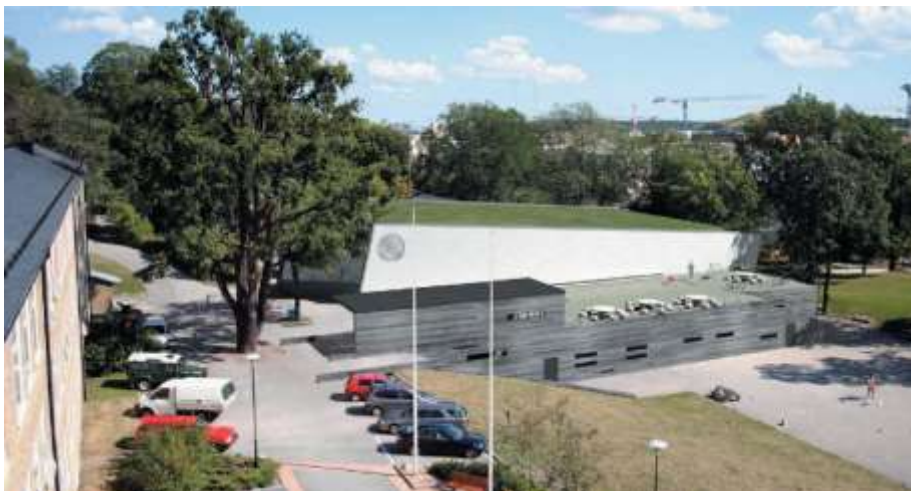
Förslag till utformning av Skanstullshallen mot skolgården.