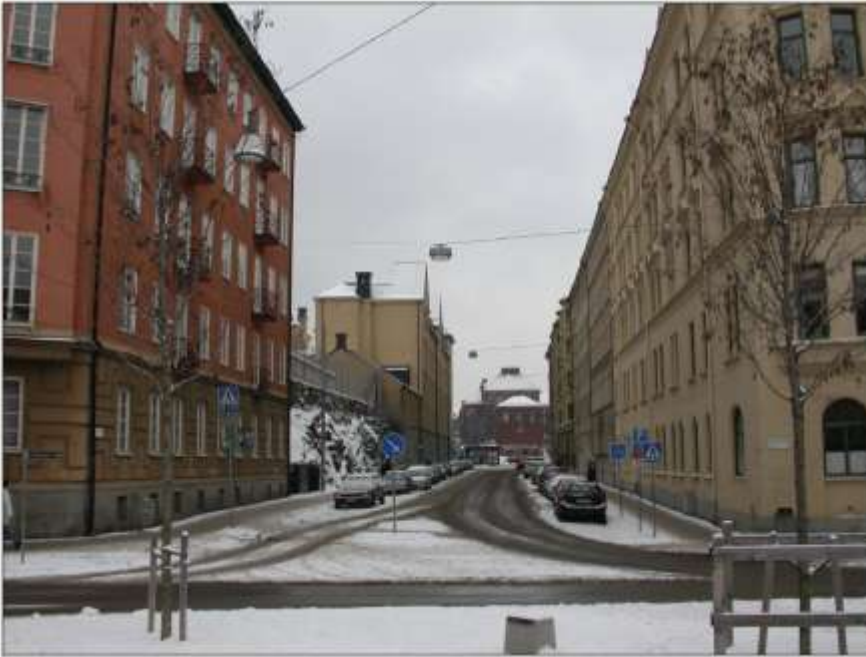
Danderydgatan från Östermalmsgatan idag.