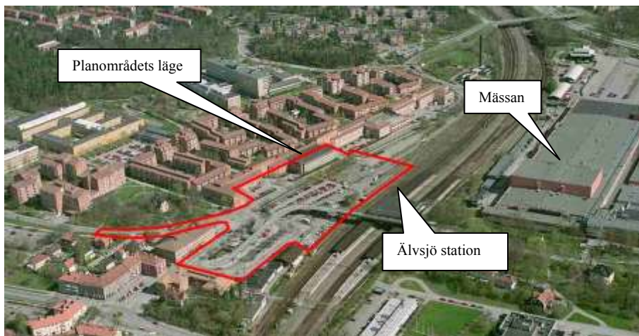
Planområdets läge i Älvsjö

Älvsjö är en viktig trafikknutpunkt. Stationen är en av de mest trafikerade järnvägsstationerna i landet. Bussterminalen trafikeras av ett flertal linjer med vilka större delen av Söderort nås.