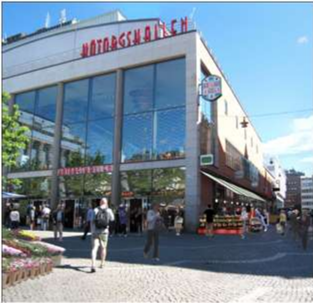
Hötorgshallen med verksamhet lokaliserad utefter Slöjdgatan

Genom åtgärderna av Hötorgshallen i gatuplan sammanbinds och förstärks kopplingen till Hötorgets affärsstråk. Intrycket av Hötorgshallens signum "handel" förtydligas därmed.